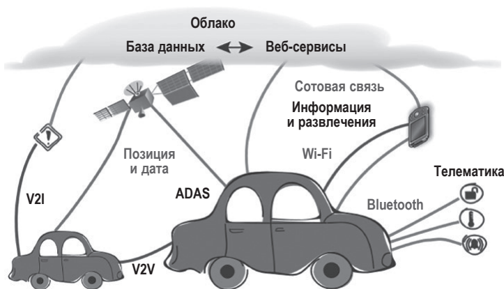
Рис. 1.1 Пример каналов передачи данных в подключенном автомобиле

В завершение этого краткого общего введения на рис. 1.2 показано транспортное средство, обладающее определенными подключениями и функциями автономности.