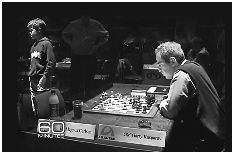
Тринадцатилетний Магнус Карлсен (слева) и легендарный Гарри Каспаров на турнире по быстрым шахматам в Рейкьявике, 2004 г. На лице Каспарова проступает явное недовольство

В этой главе мы коснемся некоторых основных тем нашей книги, поэтому не удивляйтесь тому, что вам придется переключать восприятие с одного предмета на другой. Способность переключать внимание — сначала ухватывать деталь изучаемой общей картины, а потом возвращаться к предмету для полного понимания происходящего — сама по себе составляет один из главных предметов этой книги.