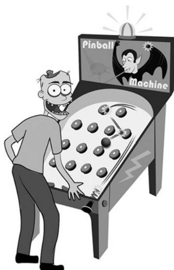
Этот зомби со счастливым лицом — игрок в мыслительный пинбол

Для лучшего понимания сфокусированных и рассеянных мыслительных процессов мы немного поиграем в пинбол (метафоры — мощное средство для изучения математики и естественных наук). В старой игре вы отводите пружинный рычажок и он вбрасывает на поле шарик, который потом беспорядочно мечется между круглыми резиновыми буферами.