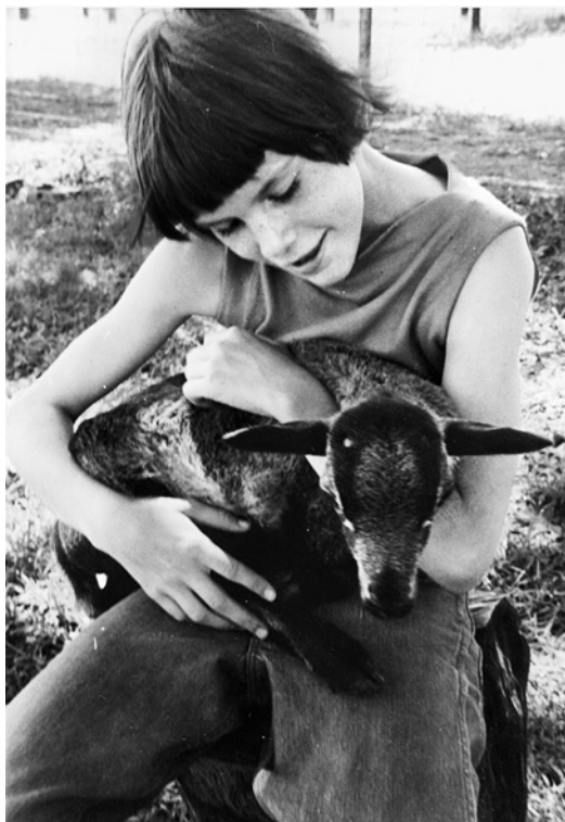
Я в десятилетнем возрасте (сентябрь 1996-го) с барашком по кличке Граф.

смертельных болезней — их хотелось избегать любой ценой. Я и не знала, что сосредоточиться на математике проще простого: для этого существуют несложные мыслительные приемы, полезные не только для тех, кто слаб в математике, но и для тех, кто в ней уже силен. Я не понимала,