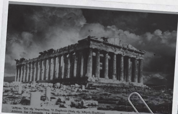
Ἀθήναι. Ἐπί τῆς Ἀκροπόλεως. Ὁ Παρθενών (Ναὸς τῆς Ἀθηνᾶς Παρθένου). Athènes. Sur l'Acropole. Le Parthénon (Temple d'Athènes Vierge).

Прибыли на задание в Парфенон? Оденьтесь как турист, а не как модель с подиума.