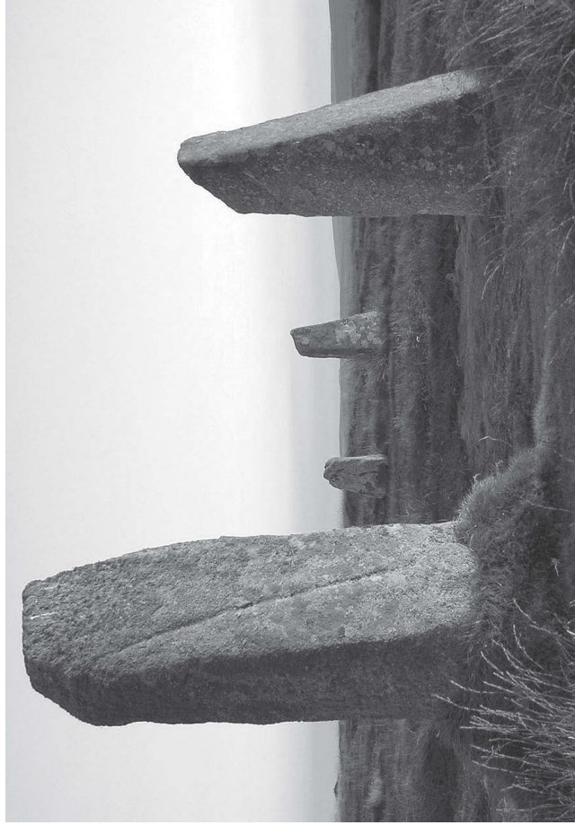
Кромлех Боскеднан. Великобритания