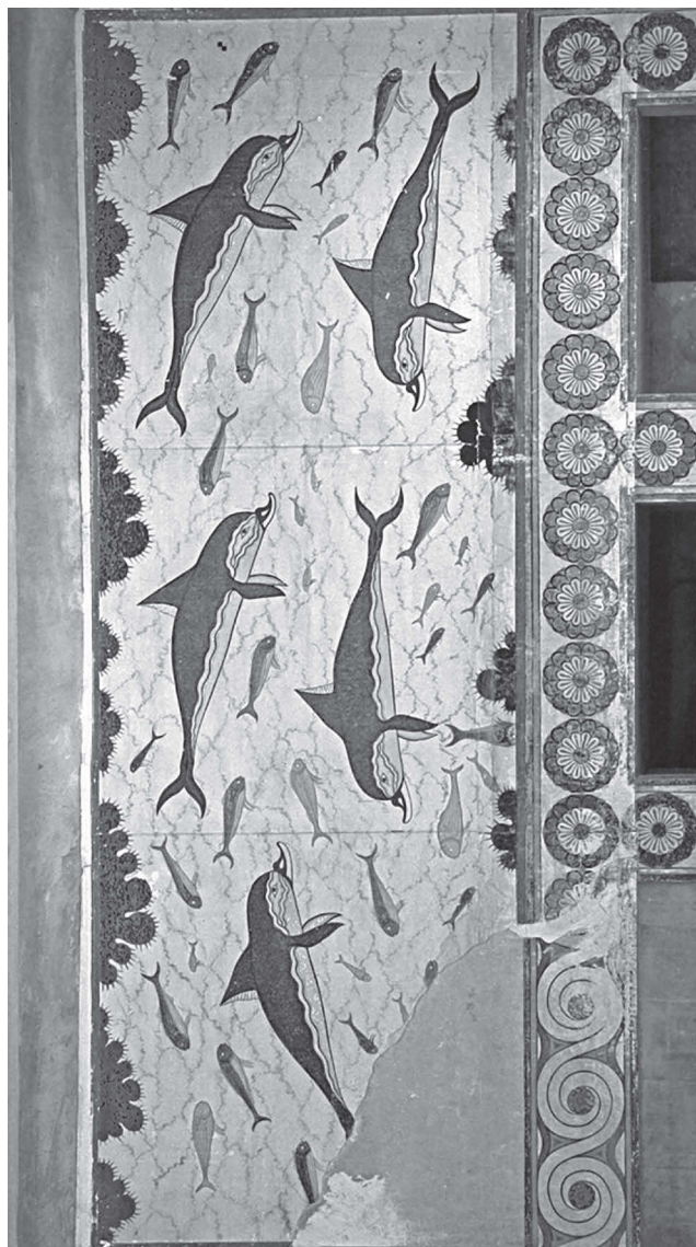
Фреска с дельфинами из Кносского дворца