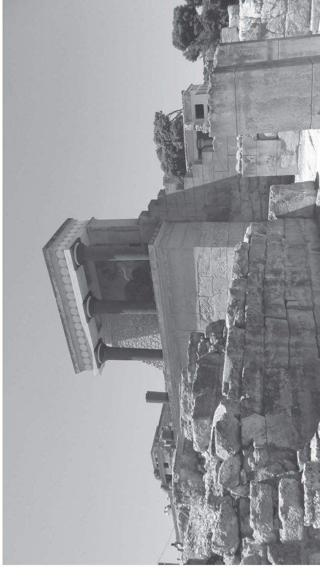
Кносский дворец на Крите.