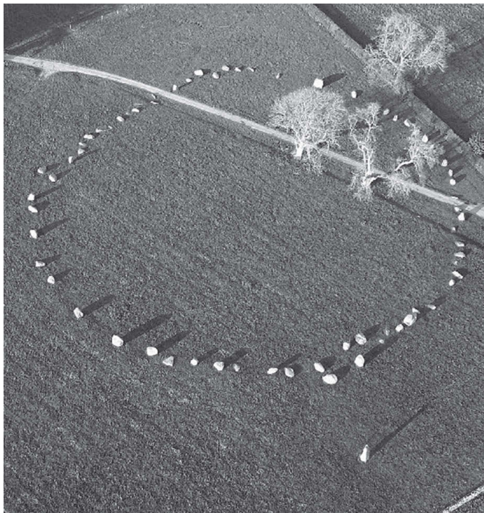
Кромлех Длинная Мег и ее дочери. Великобритания