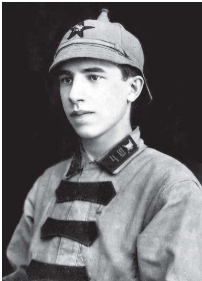
Атлантолог Николай Феодосьевич Жиров

Атлантида — Европа» (1927). Поклонником Атлантиды был поэт К. А. Бальмонт, посвятивший рассматриваемому мифу поэму «Город Золотых Ворот». Атлантида