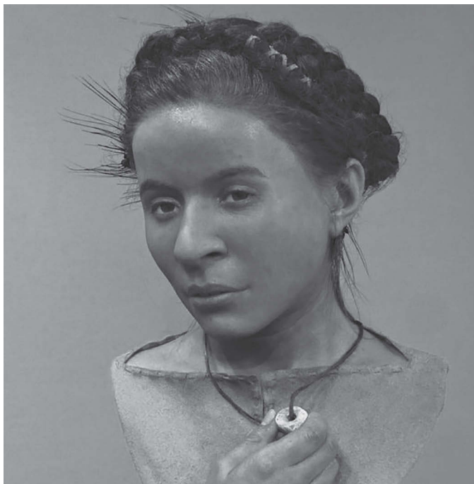
Реконструкция облика неолитической жительницы Британии