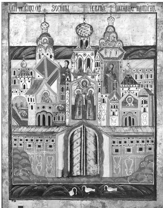
Обитель соловецких чудотворцев. Икона XVII в.