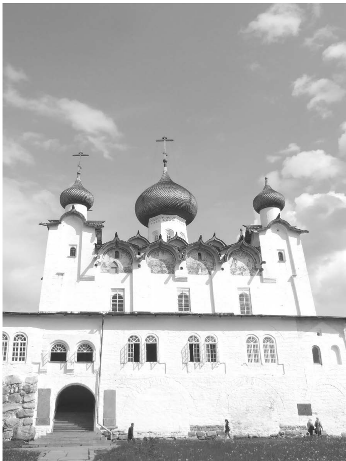
Спасо-Преображенский собор. 2009 г.