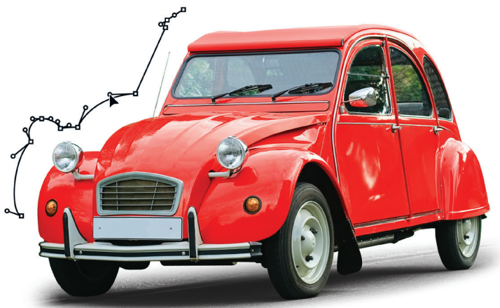
РИС. 1.2. Поль де Кастельжо с помощью кривых Безье создал округлый дизайн автомобилей для компании «Ситроен»

До появления кривых Безье в первых системах CAD/CAM было невозможно создавать плавные кривые. По мере совершенствования технологий в 1970х и 1980х годах они появились в графическом редакторе Illustrator, а затем в FreeHand.