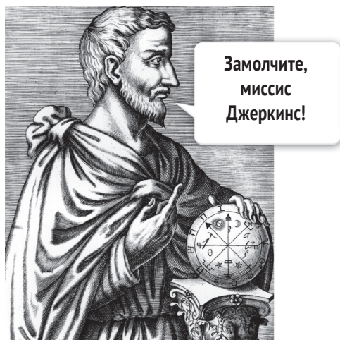
РИС. 1.1. Полагаю, Пифагор отругал бы миссис Джеркинс за то, что она создала у меня такое ложное впечатление о математике

Я знал, что не смогу ответить правильно. От досады я заплакал. С тех пор я терпеть не мог математику (рис. 1.1). Она меня пугала.