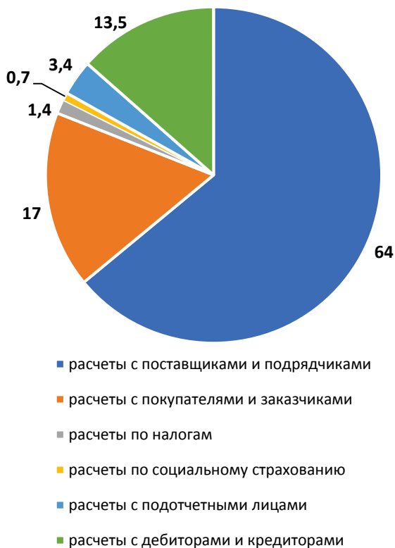
Рис. 2. Структура кредиторской задолженности на начало года, %

В структуре краткосрочных обязательств на начало года наибольшую долю занимают заемные средства — 75,5 %, а на конец года кредиторская задолженность — 63,89 %. В абсолютной сумме кредиторская задолженность в конце года увеличилась на 3 106 500 тыс. руб. (темп роста 309,9 %), а краткосрочные займы уменьшились с 4 565 000 тыс. руб. до 2 588 000 тыс. руб. (темп роста 56,6 %). В структуре кредиторской задолженности на конец года наибольшую долю составляют задолженность заказчикам. Причем доля этой задолженности возросла с 17 % на начало года до 63 % на конец года (рис. 2, 3).