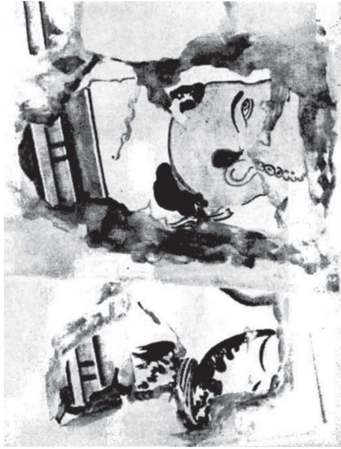
Изображение вождя хунну Модэ. Фрагмент росписи дворца в Халчаяне