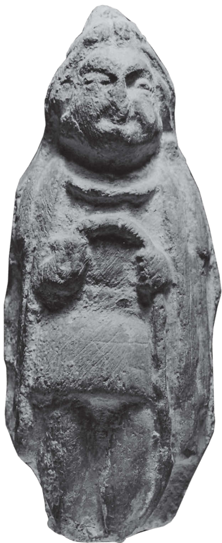
Юечжийский царь-пастух (прообраз Чапан-аты). Терракота. Кишлак Ушар (Сурхандарьинская область)