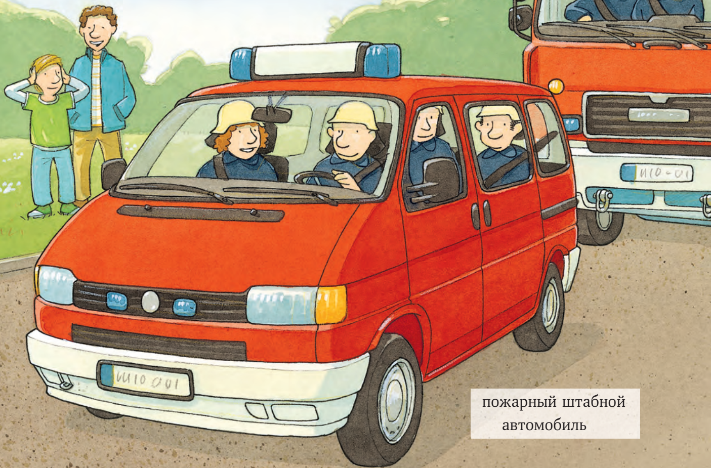
пожарный штабной автомобиль

И тут прозвучал сигнал тревоги! – Учебная тревога, – пояснил Томас, – но всё по-настоящему. Несколько человек поспешно спустились по столбам и облачились в боевую одежду пожарных, которая защищает от огня, воды и даже холода. Всё происходит очень быстро, каждая секунда важна.