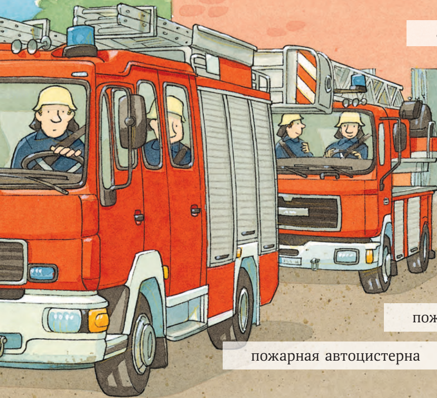
автомобиль пенного тушения