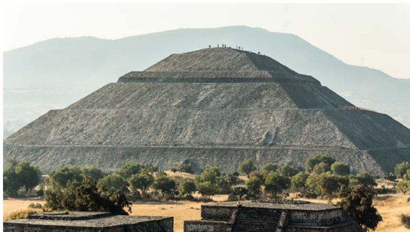
Пирамида Солнца в Теотиуакане

Раскопки начала XX в. доказали, что «замок» являлся Храмом Кетцалькоатля и что «стена» состояла из 7 м, в верхней части которых находились пирамидальные постройки. Как показали исследования, эти строения представляли собой небольшие храмы, в которых проводились церемонии и празднества.