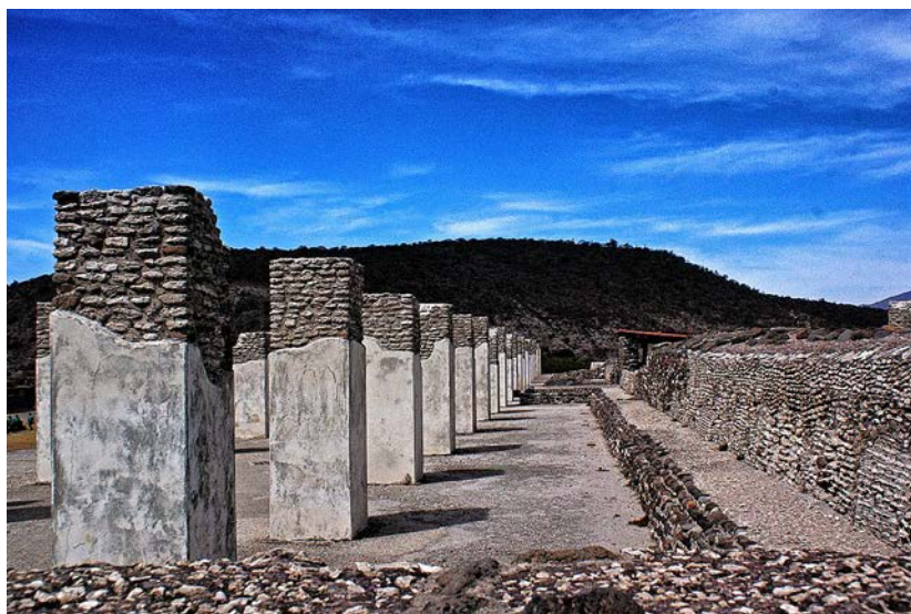
Тула, центр мастеров

Он расположен в 75 км на север от Мехико-Сити. Слово «тольтек» означает «искусный мастер», и Тула раскрывает перед нами богатое творческое прошлое тольтеков. Тула был основан ориентировочно в 1000 г. н.э. после падения Теотиуакана и до расцвета Теночтитлана. Тула славится своими колоннадами, просторными помещениями, воинами-«атлантами» – вырезанными из камня фигурами, высотой 4,5 м, которые стоят на вершине пирамиды Утренней Звезды.