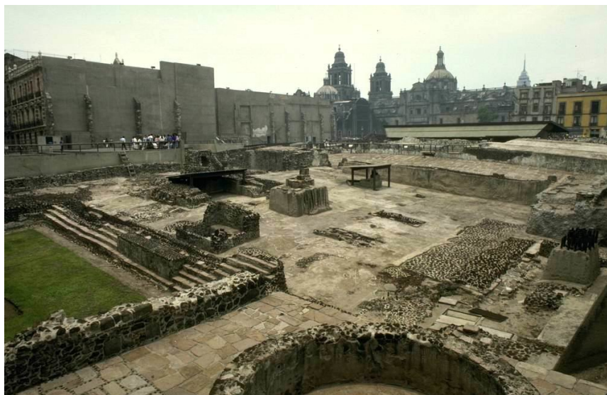
Теночтитлан – остатки ацтекского города

ких зданий – часовен, святилищ и резиденций целой армии жрецов.