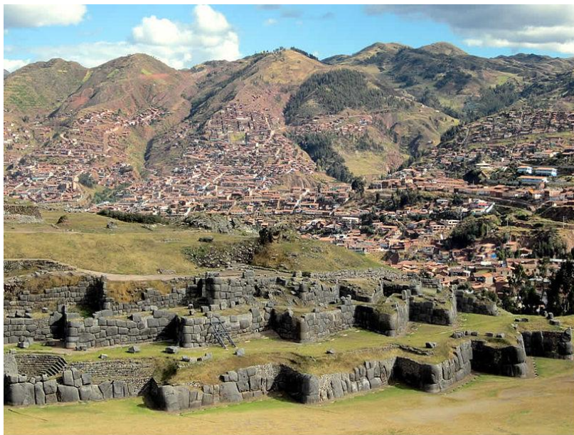
Вся история Мезоамерики – загадка

(от рубежа нашей эры до испанского завоевания) совпадала в целом с южной границей самой южной мезоамериканской цивилизации – индейцев майя, т. е. проходила по землям Западного Сальвадора и Западного Гондураса. Территориально Мезоамерика включала в себя Центральную и Южную Мексику, Гватемалу, Белиз, западные районы Сальвадора и Гондураса. В этой области, отличающейся необычайным разнообразием природных условий и пестрым этническим составом, на рубеже нашей эры произошел переход от варварства к цивилизации и государственности, что сразу же выдвинуло местных индейцев в число наиболее развитых народностей древней Америки.