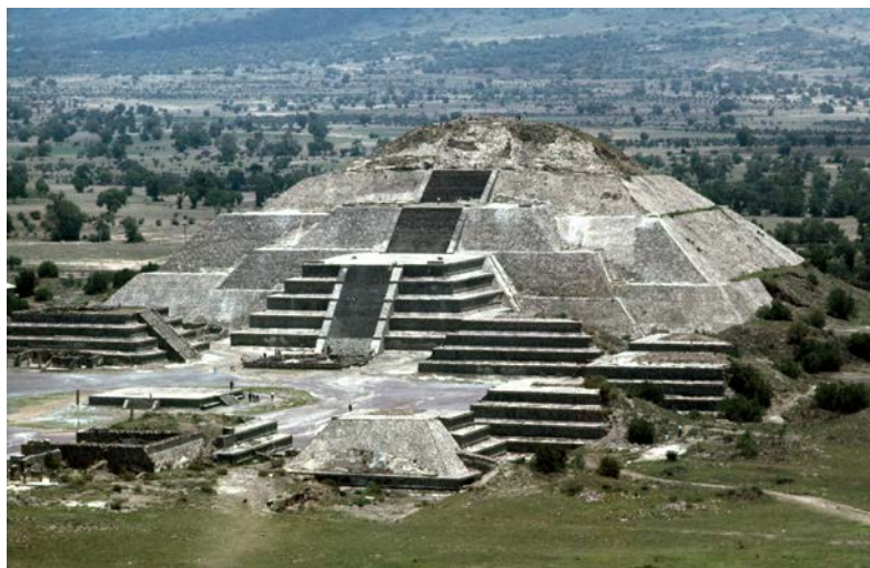
Пирамида Луны в Теотиуакане

Дорога мертвых – путь, длина которого составляет 2 км на участке от пирамиды Луны до Цитадели и далее на юг еще примерно 3 км. По всей своей протяженности она не раз прерывается: сначала Цитаделью, затем Большим Ансамблем (местом, где располагался городской рынок). В результате такого рода пересечений, а также строительства улиц, параллельных дороге Мертвых, город оказался поделенным на районы и пригородные зоны, ориентированные строго по частям света. Здания, расположенные вдоль дороги Мертвых на протяжении 2 км, имеют очень похожий и типичный для Теотиуакана архитектурный стиль, несмотря на то, что каждое из них обладает своими особенностями.