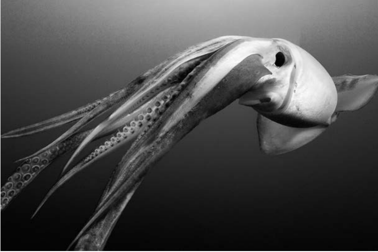
Рис. 1.1. Перуанско-чилийский гигантский кальмар, или кальмар Гумбольдта, может достигать 2 м в длину и откладывать миллионы яиц. Благодаря своим размерам и численности они обеспечивают крупнейший в мире промысел беспозвоночных

гими хищниками. Для сравнения: крупнейшее рыбное хозяйство в мире занимается добычей перуанского анчоуса, небольшой рыбки, в основном перерабатываемой в рыбную муку и рыбий жир. В 2014 г. люди выловили более 3 млн т анчоуса 3 . Сравните это с 2 млн т кальмаров, съеденных морскими слонами... только на одном острове. В 1980-е гг. ученые подсчитали, что масса головоногих, поедаемых китами, тюленями и птицами, превышает общий объем вылова всех морских животных (включая рыб, головоногих и пр.) всеми рыболовными флотами мира 4 .