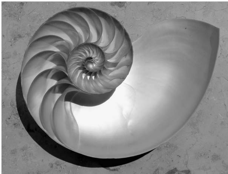
Рис. 1.3. Раковина современного наутилуса в разрезе выглядит как логарифмическая спираль

по поверхности на мускулистой ноге и тащат на себе закрученную раковину. Клемы* зарываются с помощью ноги в донный грунт и прячутся в своей двустворчатой раковине. Кальмары разделили ногу на руки и щупальца, а мантию используют для реактивного движения, избавившись от функции образования раковины.