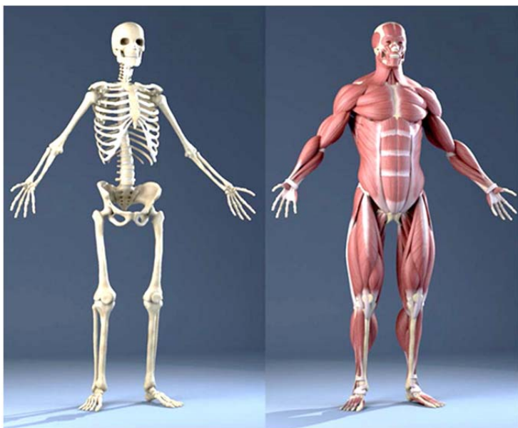
Рис. 1. Скелет и мышцы человека

Все органы движения, обеспечивающие перемещение тела в пространстве, объединены в единую систему, к которой относят кости, суставы, мышцы и связки (рис. 1).