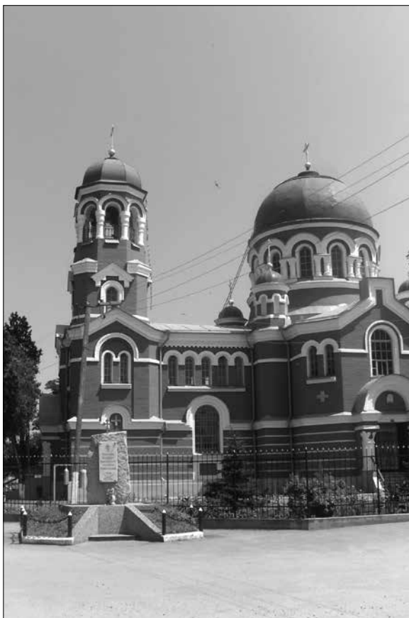
Церковь святого Архистратига Михаила. Быв. станция Пришибская (ныне г. Майский)