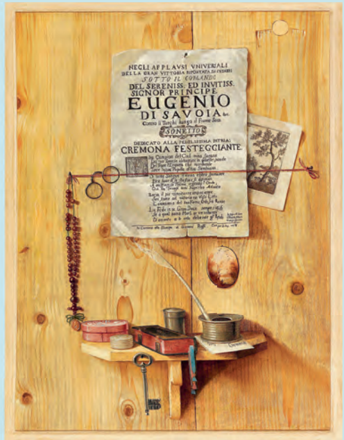
Антонио Джанлиси Младший. Пара тромплёв. 1718. Холст, масло