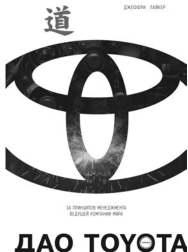
Рис 1.1. «Дао Toyota»