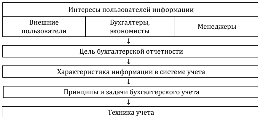
Рис. 1.1. Концептуальные основы бухгалтерского учета

В Германии с 1986 г. действует Закон о балансах, на основе которого приняты Основные положения по ведению бухгалтерского учета и составлению балансов.