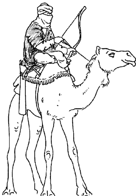
Арабский воин на верблюде. Рис. И. В. Кирсанова

Парфянская тактика ведения боя представляла собой классический вариант тактики кочевников. Это объяснялось как кочевым происхождением основателей Парфянской державы, так и постоянным влиянием, которое оказывала на Парфию степная периферия. Многие парфяне позаимствовали у североиранских племен саков и массагетов. Легковооруженные конные лучники, а также всадники на верблюдах (если таковые имелись), приближаясь к врагу, осыпали его