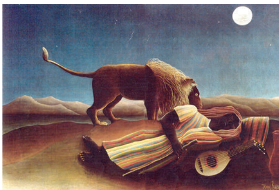
Рис. 2 Картина Генри Руссо «Сон»

гичны: в момент расслабления во сне происходит активизация целительных («утро вечера мудренее») бессознательных структур, активизация энергии, которая не приводит к привычному ее подавлению и удержанию (к примеру, удержанию чувств в «русском теле», Баскаков В., 1998) или, наоборот, отреагированию, а позволяет максимально полно ее принять («заземлить»). Это способствует ее разблокированию и гармонизации. Прекрасной метафорой такого рода баланса может служить известная картина Генри Руссо (Henri Rousseau) (Рис. 2), на которой изображены спящий певец и стоящий над ним лев.