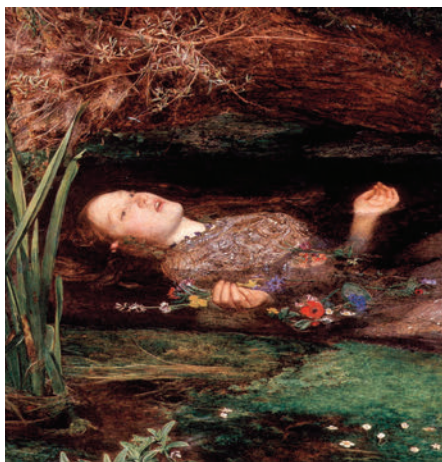
Рис.1 Утонувшая Офелия

Только в первые минуты смерти тело человека максимально расслабляется (ср. «покойник» — от покой), сверхконтроль сознания покидает тело, и последнее становится объектом/предметом (ср. «мертвецки пьян», а, значит, падает как куль). У тех, кто профессионально занимается перевозкой-переноской таких только что умерших тел существуют специальные приемы перемещения таких абсолютно пластичных, «текущих» тел. В силу этой причины многие техники релаксации в качестве идеального, т.е. максимально расслабленного объекта используют образ тела умершего человека (сравни, «позу мертвого человека» из йоги). Мертвое тело занимает ряд важных для тотального расслабления позиций: руки и ноги полностью раскрываются, отпадает нижняя челюсть, глаза приоткрываются. На картине известного английского художника Джона Эверетта (Рис. 1) уто-