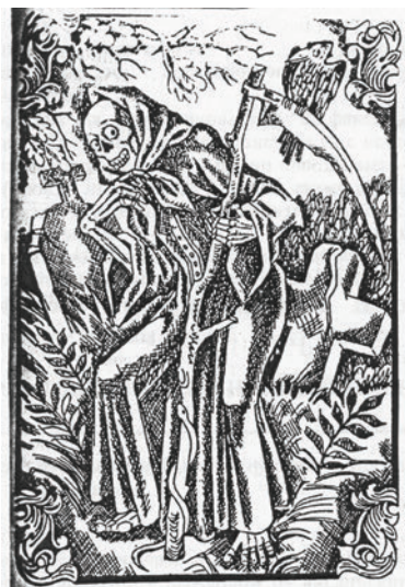
Рис. 3 Традиционное изображение смерти — с косой

тело максимально «заземлено» за счет максимально полного контакта с тем, на чем мы лежим), еще реже мы располагаем руки открытыми ладонями вверх поверх одеяла (по А.Солженицыну — это один из видов пыток политических заключенных в ГУЛАГе), совсем не отпускаем нижнюю челюсть (см. ниже), не разваливаем ступни ног. И самое главное — мы не привычно сваливаемся в сон (строки культовой песни «если смерти — то мгновенной!»), а медленно ждем приближения Гипноса. В таком случае нам становится понятным смысл изображения смерти не с автоматом Калашникова или с топором, а именно с косой.