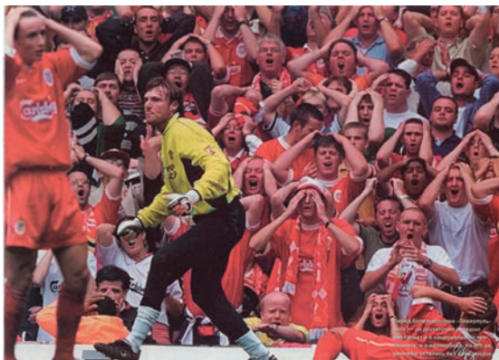
Фото 5. Ну, дает!

Этот вид смерти вытекает из перехода психически здорового человека в психически больного (мы говорим в «ненормального»), что являет собой смерть прошлой личности (сущности, Self, Эго и др.). Это напрямую связано с потерей контроля со стороны сознания и проявляющимся страхом (слова поэта «не дай нам Бог сойти с ума!»). Чувства и контроль связаны между собой. Мы теряем контроль («срываемся») тогда, когда «нас доведут», т.е. когда сила чувств будет избыточна. Интересно наблюдать следующую «телесную мизансцену»: в момент, когда футбольный защитник забивает гол в свои ворота, — весь стадион, все болельщики данной команды хватаются за голову . Если бы это было возможно, — они просто лишили бы себя головы (см. Фото 5)! Отсюда и выражение «без царя в голове», т.е. человек, не контролирующийся свои действия, не способный соображать.