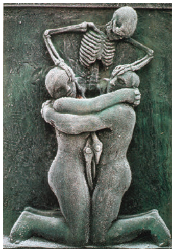
Фото 3. Смерть пытается разнять влюбленных

Другой ответ мы можем найти на одном из могильных камней, изображающих влюбленных, крепко прижимающих друг друга (Фото 3). Смерть на этом изображении, вторгаясь в этот контакт, — пытается разнять влюбленных.