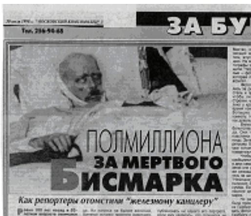
Фото 1. Мертвый Бисмарк.

Интересно, что после смерти с телом умершего часто производят определенные действия, направленные на приведение «в норму» этих полностью раскрытых частей тела: глаза закрывают, нижнюю челюсть подвязывают платком, руки и ноги связывают (Фото 1).