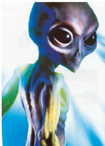
Рис. 5 Изображение пришельца

Интересен прогноз на будущее. Если посмотреть как выглядят пришельцы, как их рисуют, снимают, изображают в кино, первое, что бросается в глаза, – огромной величины голова («шибко умные», высочайший контроль) (см., Рис. 5). А это – посланцы из будущего! Вот и прогноз!