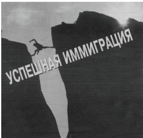
Фото 2. Модель успешной иммиграции

Отсутствие инициации при «переходе», например, при смене места жительства, страны проживания, рождает мучительное чувство ностальгии. В каком-то смысле, это нонсенс. Мы жители одной страны — Земли! Но разделенность на государства, политические системы, вероисповедания рождает «переходы» и их проблему. Хорошей иллюстрацией идеи перехода применительно к проблемам иммиграции служит реклама одного из агентств, оказывающих помощь в «успешной» иммиграции (Фото 2).