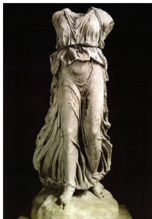
Фото 4. Идеал рожаящей женщины по Игорю Чарковскому

Применительно к отпусканию телесных импульсов представляет интерес проблема невынашиваемости у женщин или проблема невозможности зачатия. Как показывает опыт танатотерапевтической помощи таким женщинам, в том числе и наш (Баскаков В., 2002), у таких женщин — колоссальный контроль со стороны сознания. И именно этот контроль блокирует своеобразный «биологический автоматизм» родов (в терминологии Вильгельма Райха — «оргастическую конвульсию»). В этой связи, идеал рожаящей женщины для известного отечественного специалиста и родоначальника родов в воду Игоря Чарковского — это известная скульптура безголовой Ники (Фото 4).