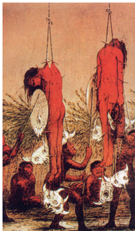
Рис. 4 Церемония инициации (посвящения в воины) в североамериканском племени манданов

В североамериканском племени манданов мальчиков, проходящих инициацию посвящения в воины, подвергают мучительной процедуре подвешивания за кожу (Рис. 4), прикрепляя к их поясам черепа животных.