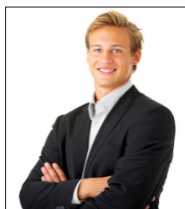
Рисунок 2 Влади́мир