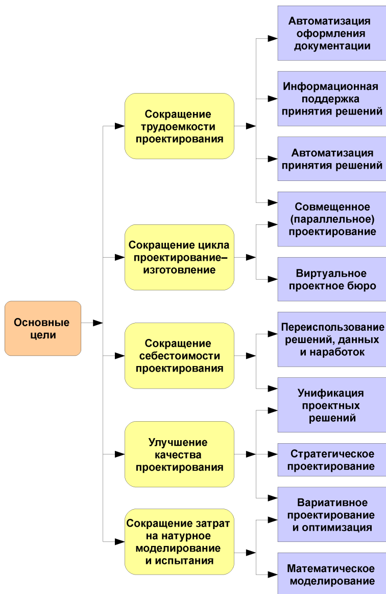
Рис. 2.1. Основные цели и методы автоматизации проектирования