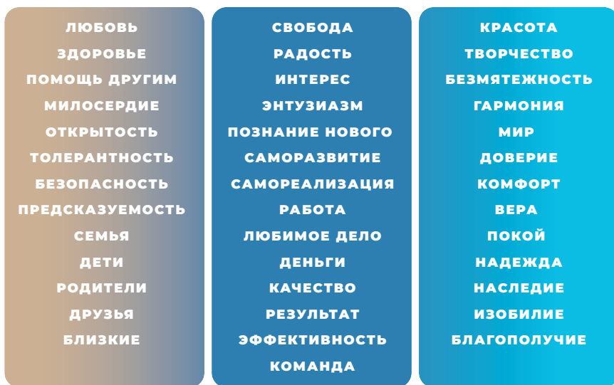
Рис. 5. Примеры ценностей

и естественным. Причем речь идет не просто о некоем наборе одинаково важных вещей, а о четкой иерархии ценностей, об их эффективной приоритизации в соответствии с тем, что вы считаете наиболее важным для себя именно сейчас, на данном этапе своего развития. Исходя из личной иерархии ценностей , вы начнете планировать свою жизнь вплоть до мелочей, таких как ежедневный график активностей.