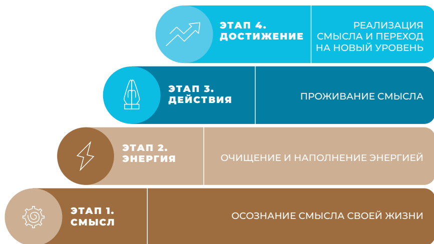
Рис. 3. Путь в жизни, наполненной смыслом