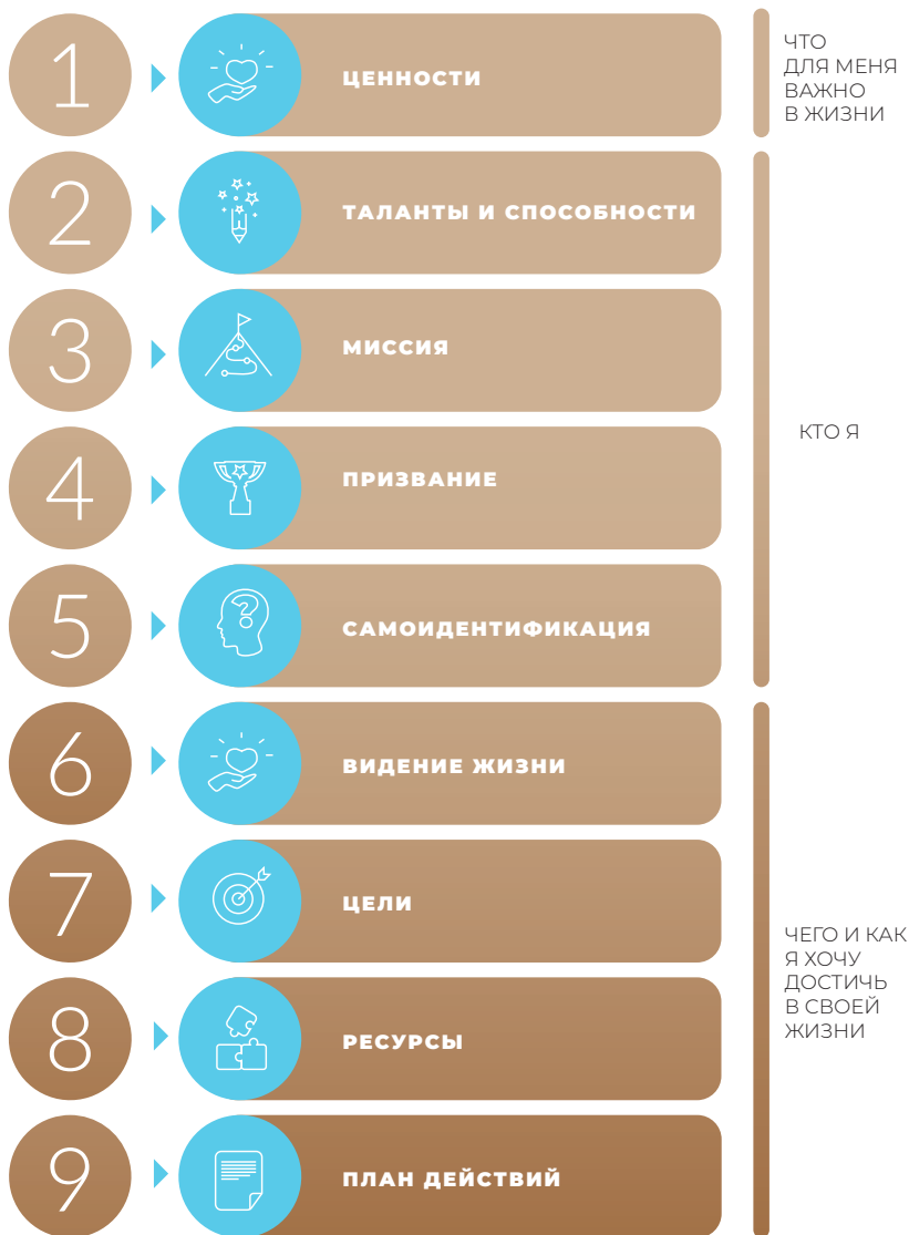
Рис. 4. Алгоритм первого этапа пути 1