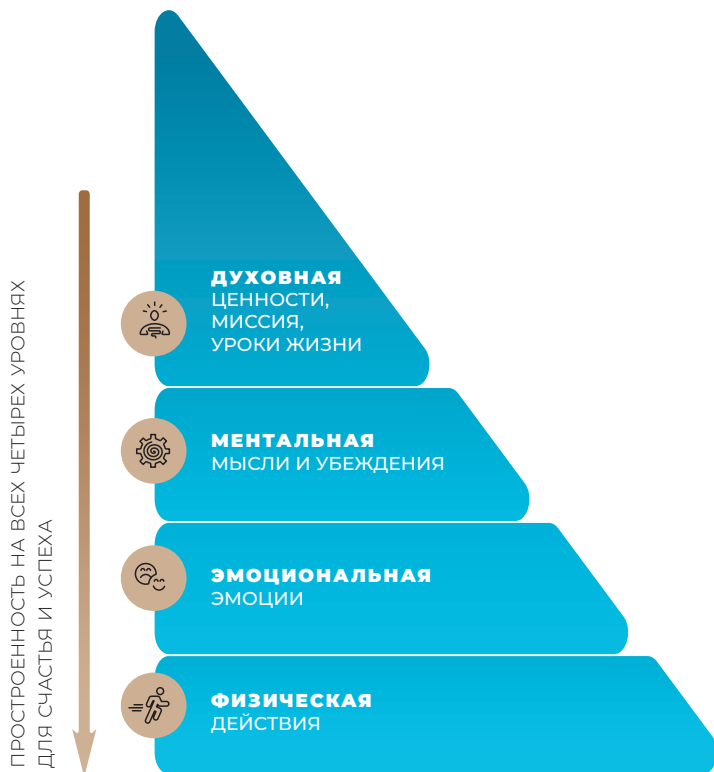
Рис. 2. Четыре типа энергии

Второе. Я считаю, что истинный успех и ощущение счастья возможны, только если человек работает со всеми уровнями своей личности — физическим, эмоциональным, ментальным и духовным (рис. 2). Когда мы понимаем, для чего пришли в этот мир и в чем смысл нашей жизни (духовный аспект), сонастраиваем