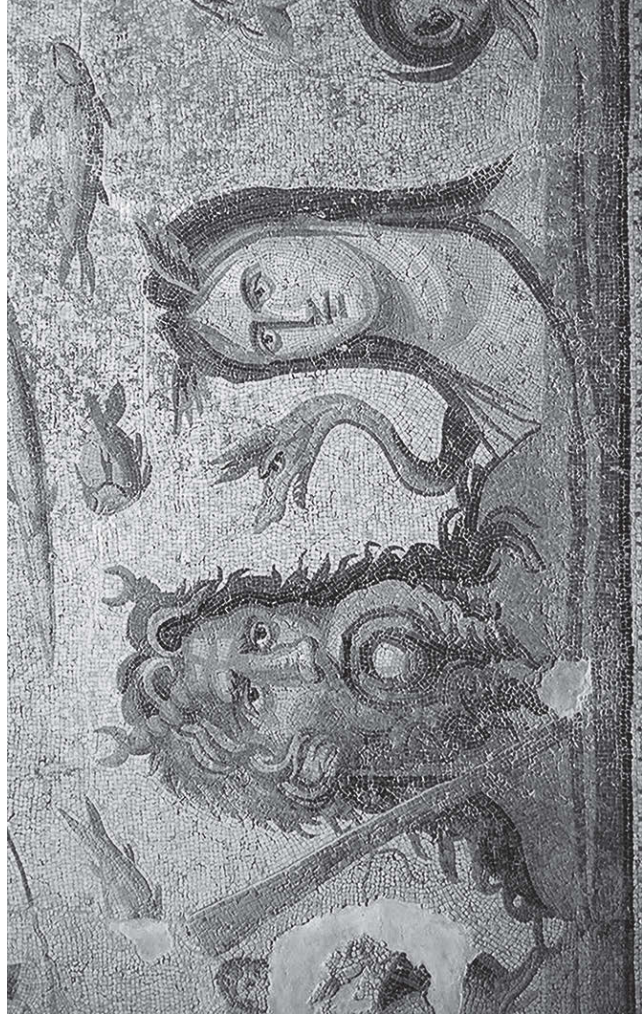
Тифида и Океан. Античная мозаика