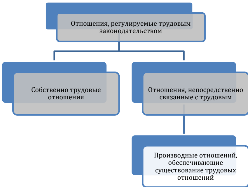
Рис. Схема трудовых отношений

Отношения, непосредственно связанные с трудовыми отношениями, принято классифицировать по времени их возникновения: