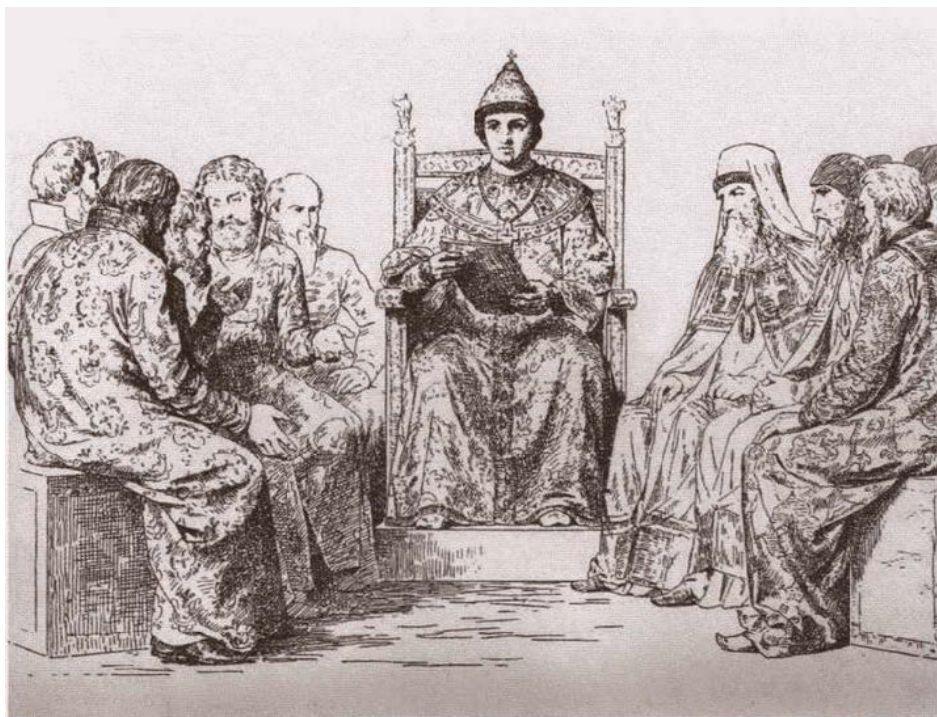
Самодержец Федор Алексеевич.

Рисунок В. П. Верещагина из альбома «История Государства Российского в изображениях державных его правителей с кратким пояснительным текстом»