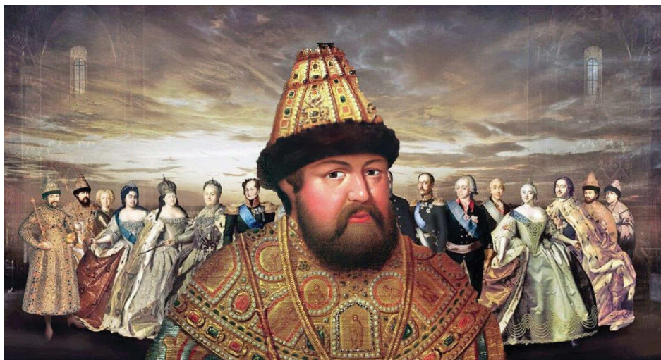
Алексей Михайлович Романов