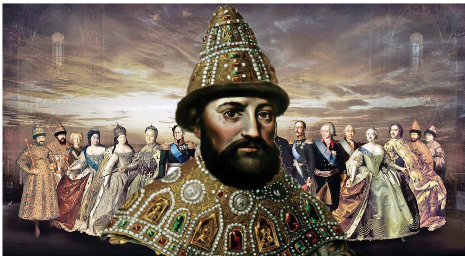
Царь Михаил Федорович Романов