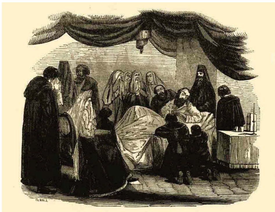
Смерть царя Алексея Михайловича. 29 января 1676. Гравюра Ельваля.1840 г.

логичным — заливать внутрь холодный квас и охлаждать тело колотым льдом. Такого лечения хватило ровно на неделю. Когда 29 января к его постели все же допустили врачевателя Рейтенфельса, было уже поздно — Алексей Михайлович метался в горячечном бреду и лишь кратковременно приходил в себя. Как тогда писали в летописях, настало время «нашествия облака смертного».