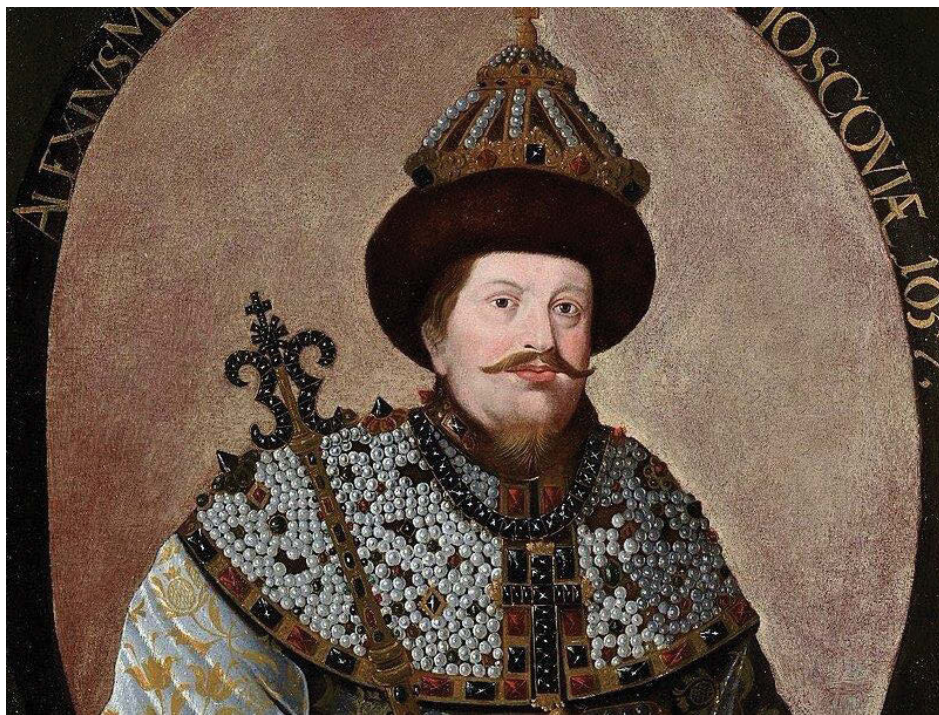
Алексей Романов. Портрет неизвестного художника, 1657 год

Уже к тридцати годам статность молодого царя постепенно начала перетекать в полноту. И вроде бы взяться ей было неоткуда (тысяча поклонов плюс крайне умеренная диета), тем не менее государь стал стремительно набирать вес. Его это не сильно беспокоило, однако лечиться он все же начал. Вот только методы лечения Алексей Михайлович практиковал сугубо патриархальные.