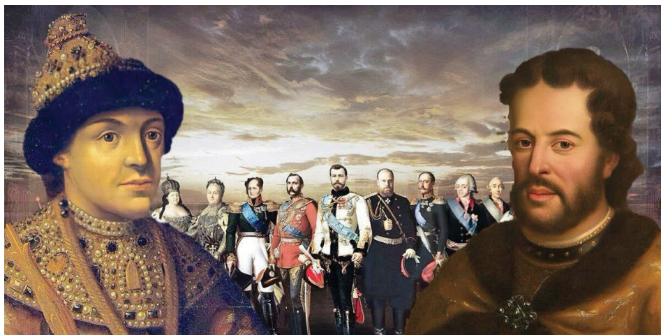
Федор Алексеевич и Иван Алексеевич Романовы