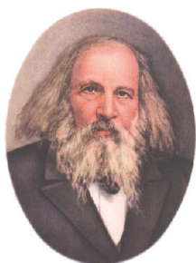
Дмитрий Менделеев (1834–1907)

Соедини в таблице имя учёного с его изобретением.