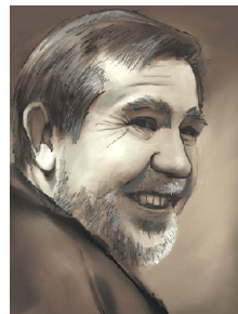
Алексей Пажитнов (1955 г.р.)