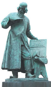
Иван Фёдоров (1520–1583)