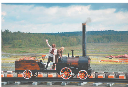
Отец и сын Черепановы: Ефим Александрович (1774–1842), Мирон Ефимович (1803–1849)