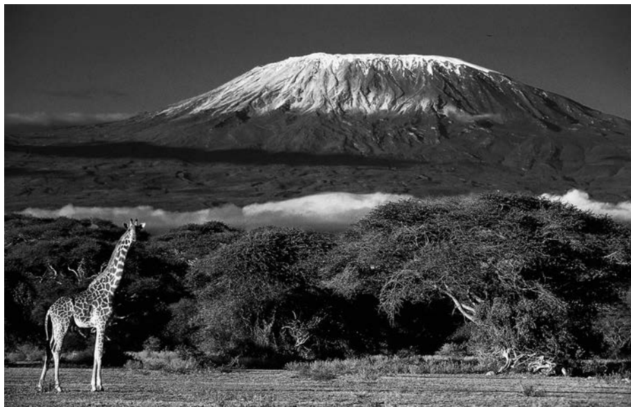
Вид на Килиманджаро из национального парка Амбосели, Кения