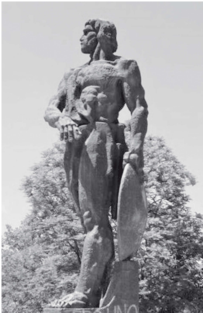
Памятник Спартаку в Болгарии