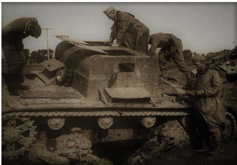
Немецкие солдаты изучают захваченный артиллерийский тягач Т-26Т. Такие машины часто использовались в качестве командирских.

недостатков предыдущих моделей (недостаточная мощность двигателя, большая нагрузка на ходовую часть, перегрев конструкции и т.п.) избавиться так и не удалось, так что машины подобного типа большого распространения не получили, преимущественно эксплуатировались тягачи Т-26Т, которых в различных вариантах исполнения на начало июня 1941 года насчитывалось порядка 200 единиц.