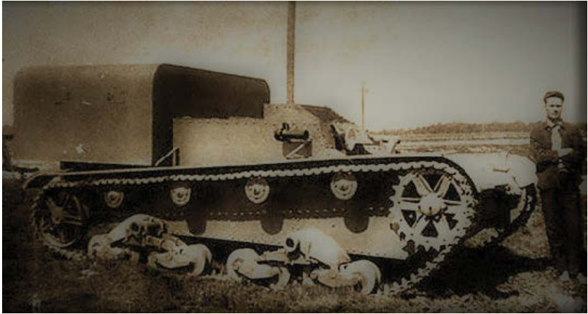
Самый первый вариант бронетранспортера на базе Т-26, ТР-1.

дения огня с хода, да и высадка десанта в боевых условиях была продумана слабо. Нужны были новые технические решения, новые, более мощные двигатели, а по большому счету – совсем другое шасси.