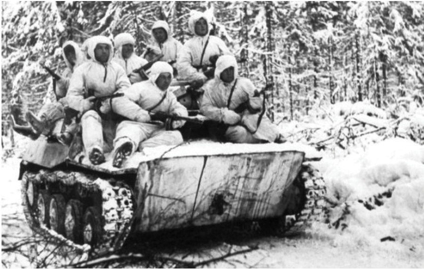
Советский легкий танк Т-40 или Т-30 с десантом автоматчиков.

связи, так что качество и оперативность передаваемых ими сведений не позволяли командиру адекватно оценить обстановку. Легкие колесные бронеавтомобили БА-20, ФАИ и др. могли действовать только по дорогам и на слабых грунтах оказывались абсолютно недееспособными. Более подходящим для ведения разведки средством был бы бронетранспортер на базе гусеничного, полугусеничного или колесного шасси повышенной проходимости с соответствующим вооружением (крупнокалиберный пулемет или ПТР), оборудованный радиостанцией или хотя бы имеющий возможность перевозить под защитой брони разведгруппу в 3–5 человек 2 .