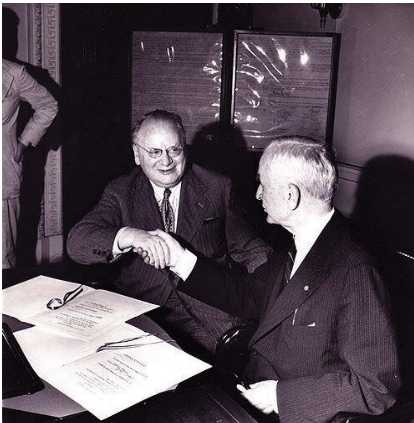
Народный комиссар иностранных дел СССР М. Литвинов и госсекретарь США Корделл Халл.

Поставки военных материалов, техники и вооружения в СССР со стороны США, Великобритании и Канады обычно ассоциируется с понятием «ленд-лиз», однако это не вполне корректно. Постараемся данный пробел (если он есть у читателя) устранить.