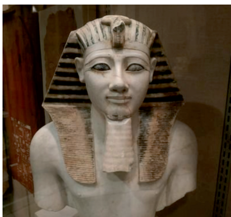
Рис. 2. Диоритовая статуя Хафра. Египетский музей

Абстрактно-знаковая форма изобразительного искусства меняется на изобразительную. Появляются первые признаки искусства как формы общественного сознания. Красота получает математическое, числовое выражение. Пропорции и выразительность движений ведут к реалистичности. Впервые появляется многофигурная композиция. Изобразительное искусство представлено скульптурой, декоративно-прикладным искусством и монументальной живописью. Определяются и первые жанры: религиозный и мифологический, бытовой жанр (повседневная жизнь), портрет. В этом историческом периоде искусство тоже выступает как форма познания мира, впервые искусство стало формой отражения реальности.