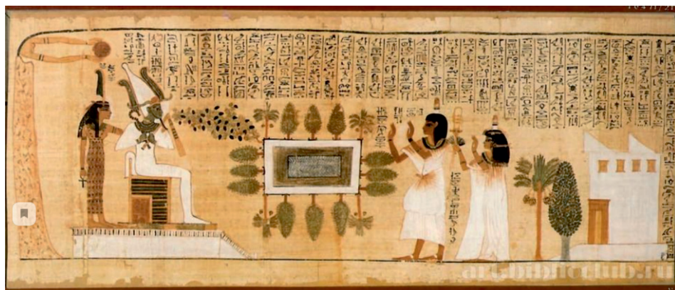
Рис. 1. Древнеегипетская живопись. Папирус, Британский музей

Продолжением искусства родового общества становится искусство первых древних государств Египта, Месопотамии и Греции. С усложнением государственного устройства изменяется искусство, ибо именно государство становится главным заказчиком и потребителем его. Теперь оно отражает не только религиозные обряды, мифологию, но и социальную иерархию общества. Важным в искусстве становится изображение человека и его положения в обществе, потому изображение фараона во много раз больше изображений рядовых членов этого общества.