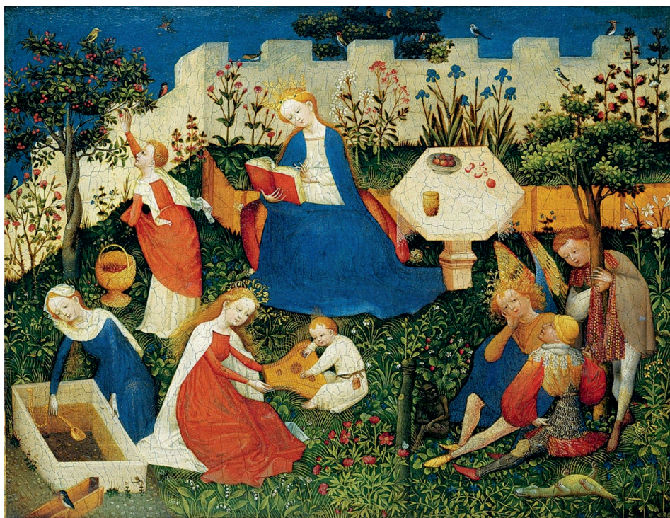
Рис. 5. Сад Марии, немецкий художник, XV век

К достижениям средневекового искусства можно отнести язык и близость к народному творчеству. Язык изобразительного искусства стал сложнее и экспрессивнее, искусство было доступно и понятно народу. Основной формой подготовки художественных кадров стали цеха и гильдии, которые поддерживали наследственные профессии. С одной стороны, они не учитывали склонности и интересы самой личности, с другой — позволяли воспринимать навыки работы почти с «молоком матери», то есть обеспечивали раннее приобщение к искусству. Все это как раз позволяло сохранять художественные традиции и медленно, но верно обновлять их. Средневековое искусство подготовило почву для новой европейской культуры Нового времени — эпоха Возрождения.