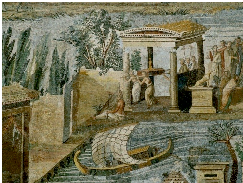
Рис. 4. Вилла Мистерий. Помпеи

турой императора — внесло свою лепту в историю изобразительного искусства. Для искусства периода существования Римской империи, представленного в большей степени скульптурой и в меньшей — сохранившимися фресками и декоративно-прикладным искусством. Здесь характерны поиски нового стиля, новых средств художественной выразительности, необходимых для воплощения общественных идей.