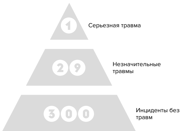
РИС. 1.1. Пирамида травматизма (закон Хейнриха)

Следующий тезис, который важен для предмета нашей книги и который был высказан Г. У. Хейнрихом, заключается в том, что основной причиной (88%) несчастных случаев на рабочем месте являются небезопасные действия работника — как правило, самого пострадавшего. Этот тезис позволил работодателям и консультантам неизменно утверждать: во всем виноват работник (рис. 1.2).