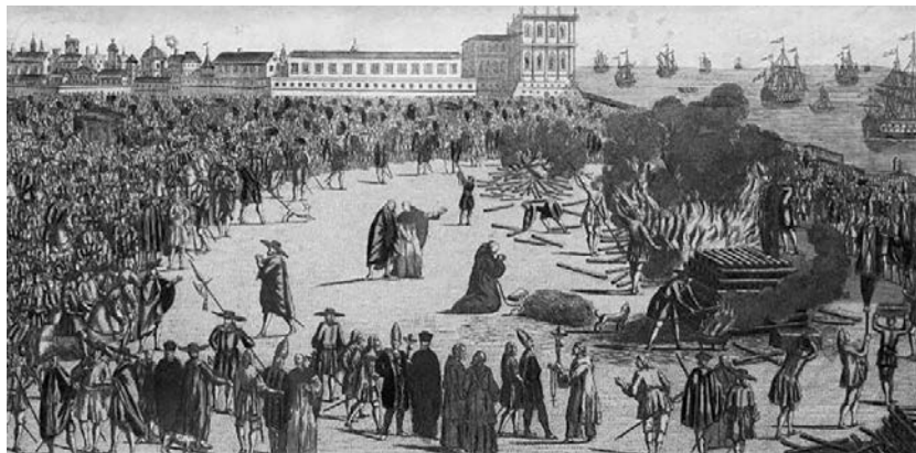
Аутодафе – «казнь без пролития крови» – визитная карточка испанской инквизиции

Хуану Антонио Льоренте, то в 1481–1808 годах только в Испании сожгли живыми 31 912 человек, а еще 29 145 подверглись другим наказаниям – были замурованы заживо, отправлены на галеры и пр. Вдумайтесь! Это ведь только «еретики» и приравненные к ним вольнодумцы-просветители, объявленные колдунами и колдуньями, просто случайные жертвы, подвернувшиеся под руку. В указанное число не входят «обычные» преступники и бунтовщики, провинившиеся перед властью светской. Формально собственноручно казнь осуществлялась в рамках юрисдикции власти светской, но поскольку она была прочно связана с церковной, то особо выделять данный аспект нет смысла.