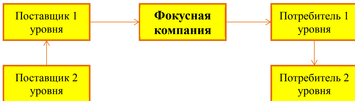
Рисунок 2.2 – Расширенная цепь поставок

Расширенная цепь поставок включает дополнительно поставщиков и потребителей второго уровня ( рис. 2.2 ).