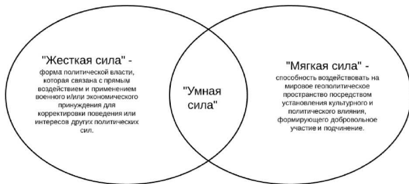
Рис. 1.3.1. Сочетание геополитических сил

формах — нейтральной либо тяготеющей к «мягкости» или «жесткости».