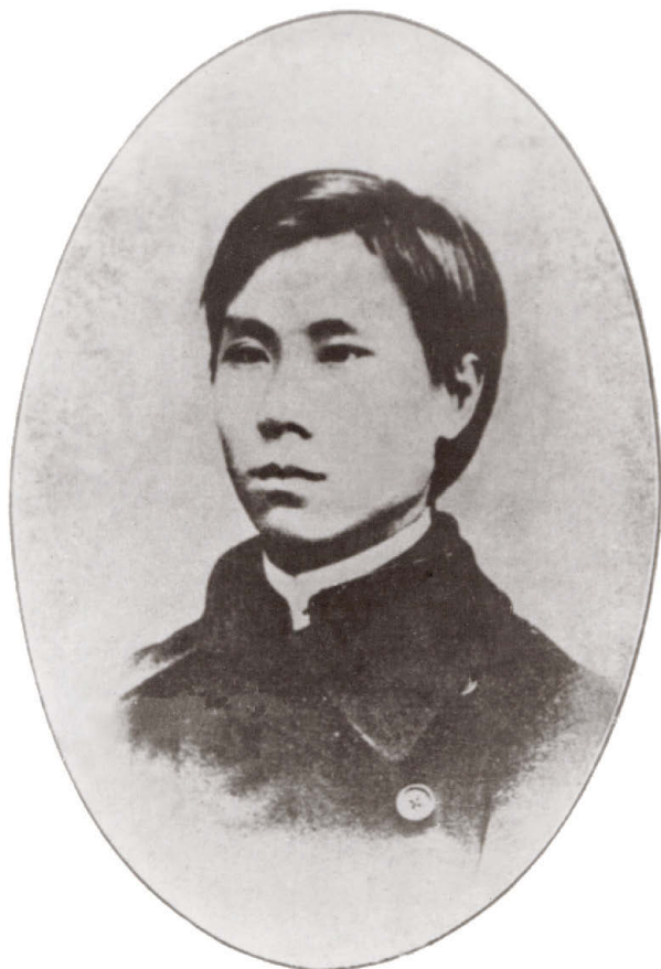
Портрет Цзоу Жун

трудов: Цай Юаньпэй перевел работу Р. фон Кебера «Суть философии», а Янь Фу — «Эволюцию и этику» Т. Гексли, «Богатство народов» А. Смита и другие сочинения. Самыми известными публицистами, распространявшими идеи демократической революции, стали Цзоу Жун, Чэнь Тяньхуа, Чжан Тайянь и Цю Цзинь.