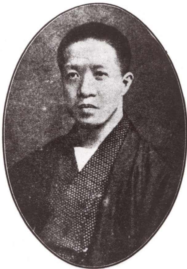
Портрет Чжан Тайяня

резкой критике монархические взгляды Кан Ювэя: автор считает, что китайский народ неизбежно осуществит революцию и впоследствии построит республиканско-демократическую систему. Тираж памфлета составил несколько тысяч экземпляров и разошелся очень быстро. Публикация в «Субао» вызвала еще больший общественный резонанс. Испуганное цинское правительство договорилось с администрацией шанхайского сэттльмента об аресте Чжан Тайяня, Цзоу Жуна и других деятелей. Редакция газеты была закрыта, началось следствие по «Делу “Субао”», которое потрясло весь мир 9 . Однако идеи демократической революции не были уничтожены, а, напротив, стали распространяться еще активнее.