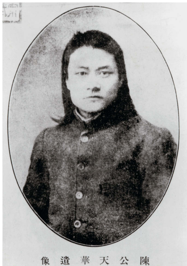
Портрет Чэнь Тяньхуа

Чжан Тайянь был интеллигентом, получившим традиционное образование. Рассматривая абсолютизм на примере истории всех стран мира, он заключает, что кровопролитие и жертвы — неотъемлемое условие обретения народом политических прав. Чжан Тайянь написал множество статей, воспевающих революцию, и превратился в ее активного пропагандиста. Наиболее характерным и влиятельным памфлетом, прославляющим революционные идеи, можно считать «Опровержение учения Кан Ювэя о революции». Сочинение подвергает