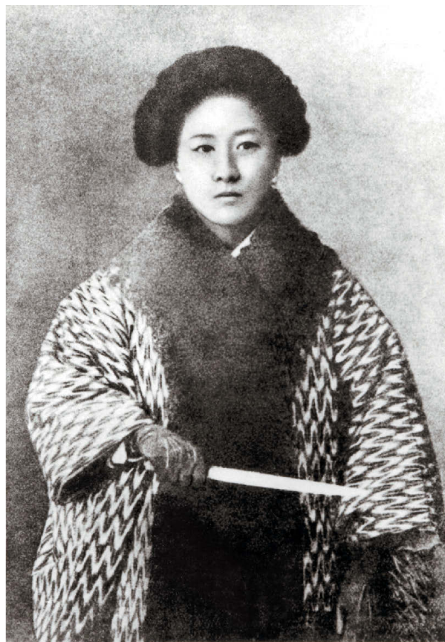
Портрет Цю Цзинь

Восстание в Гуанчжоу в 1895 году стало первым вооруженным выступлением сторонников буржуазной революции. После своего образования Союз возрождения Китая начал налаживать связь с тайными обществами, повстанцами