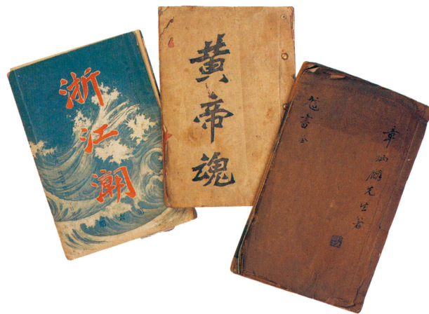
Брошюры революционных организаций

Несмотря на неудачи целого ряда организованных Объединенным союзом восстаний, народ все еще стремился свергнуть цинский