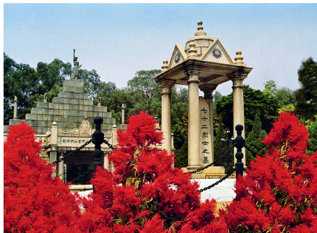
Мавзолей 72 мучеников в парке Хуанхуаган