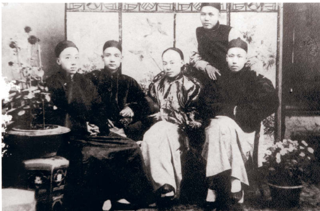
Совместное фото Сунь Ятсена с друзьями / 1888 год

Его идея сводилась к следующему: взяв за образец западные страны, использовать передовые методы сельского хозяйства на основе научно-технического прогресса, провести реформу образования и ввести систему отбора талантов. Необходимо было добиться того, чтобы «потенциал людей был полностью использован, земля приносила наибольшую пользу, вещи находили исчерпывающее применение, а товары беспрепятственно обращались». Тем не менее предложение Сунь Ятсена не нашло отклика.