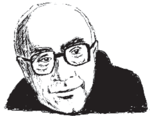
Мамардашвили Мераб Константинович (1930–1990)

Doctor: Таким образом, философия – это форма духовной деятельности, направленная на постановку, анализ и решение конкретных мировоззренческих вопросов, связанных с выработкой целостного взгляда на мир и место в нем человека. Философствование базируется главным образом на теоретических