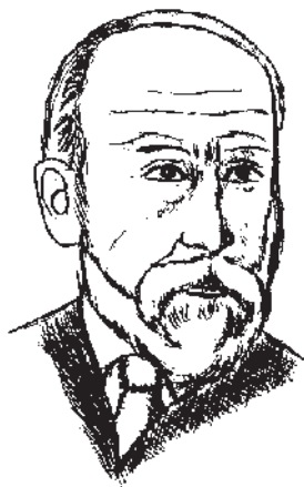
Дильтей Вильгельм (1833–1911)

в-третьих, организовано в стройную логически непротиворечивую систему воззрений и жизненного опыта. Философия, по сути, формирует мировоззрение.