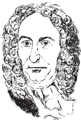
Лейбниц Готфрид Вильгельм (1646–1716)

Хосе Ортега-и-Гассет: Данное состояние порождает иллюзию доступности жизни во всех проявлениях; все дается мне только по праву моего рождения без каких-либо душевных усилий с моей стороны. Но, превращаясь в простого потребителя, я лишаюсь того «собственно человеческого», что поддерживает и воспроизводит культуру, что придает ей ценность 3 .