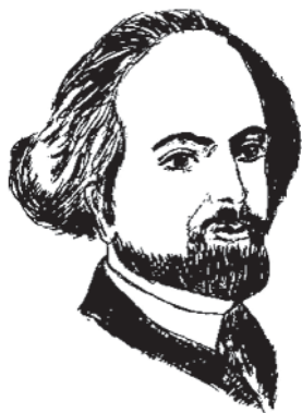
Бердяев Николай Александрович (1874–1948)

сторон. Поэтому философия есть самая незащищенная сторона культуры. Постоянно подвергается сомнениям сама возможность философии, и каждый философ принужден начинать свое дело с защиты философии и оправдания ее возможности и плодотворности. Философия подвергается нападению сверху и снизу, ей враждебна религия и ей враждебна наука. Она совсем не пользуется тем, что называется общественным престижем. Философ совсем не производит впечатления человека, исполняющего социальный заказ 5 .