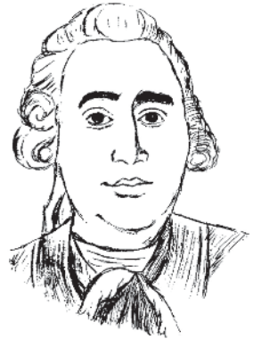
Юм Дэвид (1711–1776)

Иммануил Кант : Да, нельзя не признать скандалом для философии и общечеловеческого разума необходимость принимать лишь на веру существование