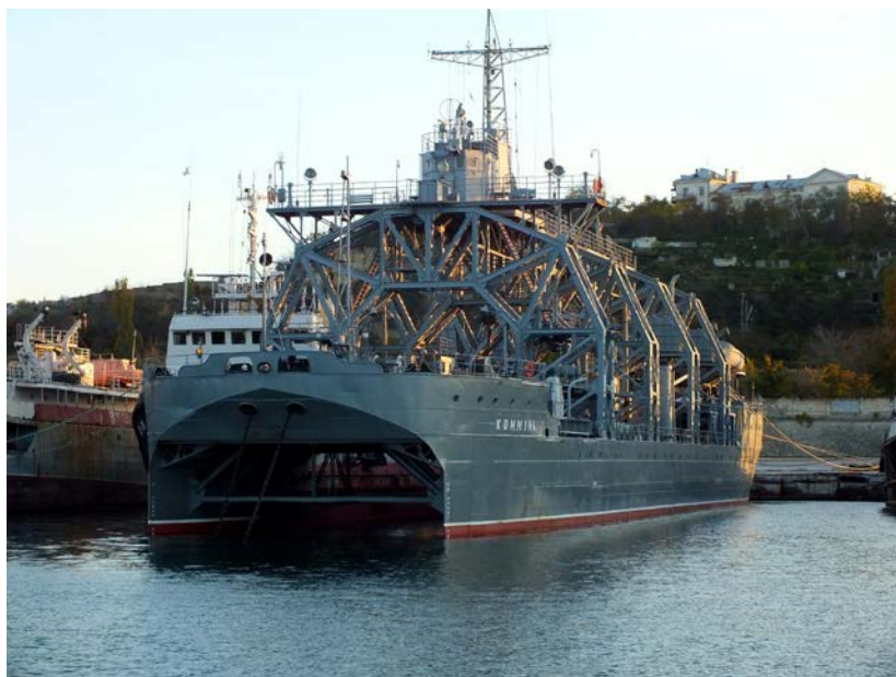
«Коммуна» у причала в Севастополе