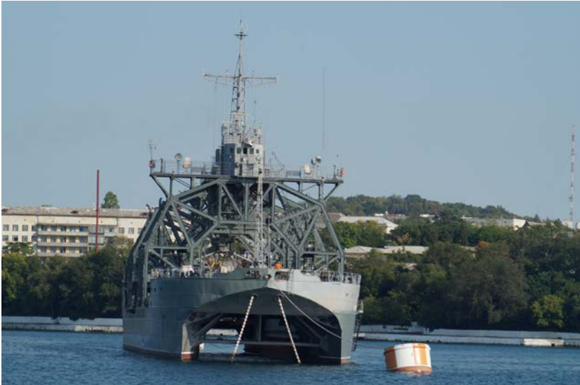
«Коммуна» на якорной стоянке в Севастополе