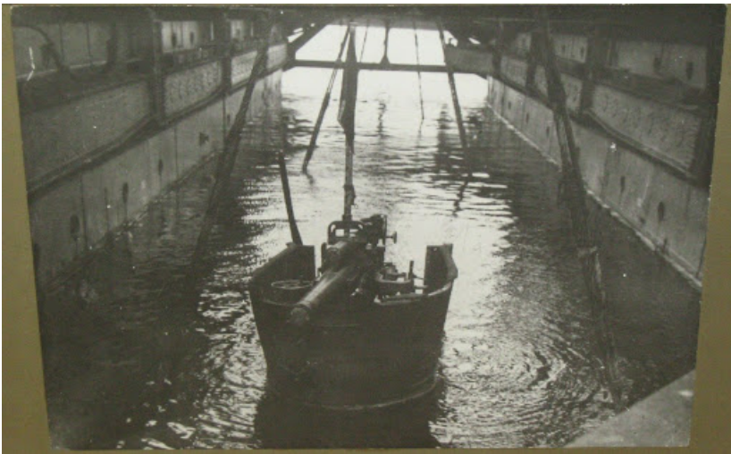
«Коммуна» поднимает английскую субмарину Л-55