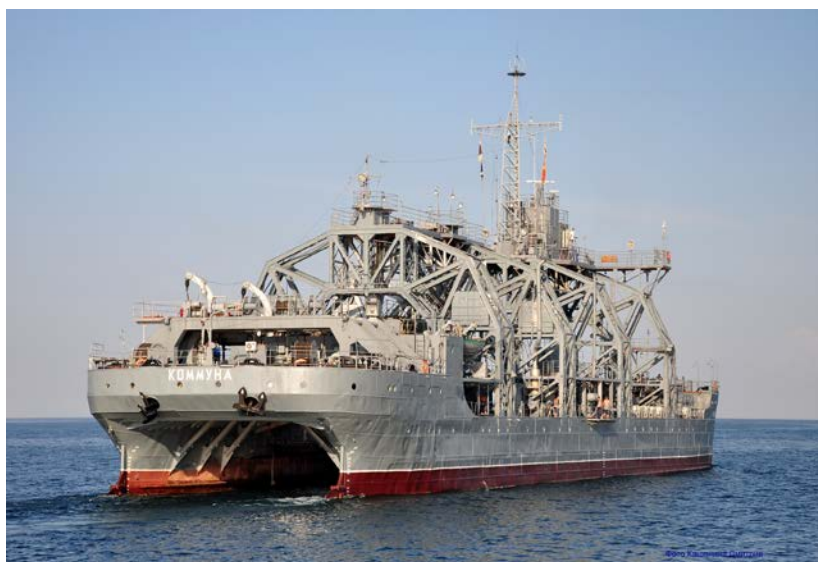
«Коммуна» в 2010 году