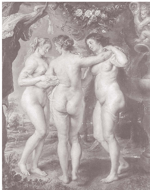
2. Питер Пауль Рубенс. Три грации. 1630–1635 годы. Мадрид. Национальный музей Прадо

бы долу, — это очаровательно, этим открываются, вернее — распахиваются настезь райские врата усад, и это погружает в непостижимую негу сердце того, кто вожделенно на это взирает» 37 . Если же рот открывается не для смеха, то показать девушка может не более пяти зубов, максимум шести — причем верхних. Такая дотошная прикладная физиогномика, поданная к тому же как приятная дружеская беседа, с колкостями и остротами, говорит не о педантизме, а о чувствительности глаза итальянца времен Рафаэля.