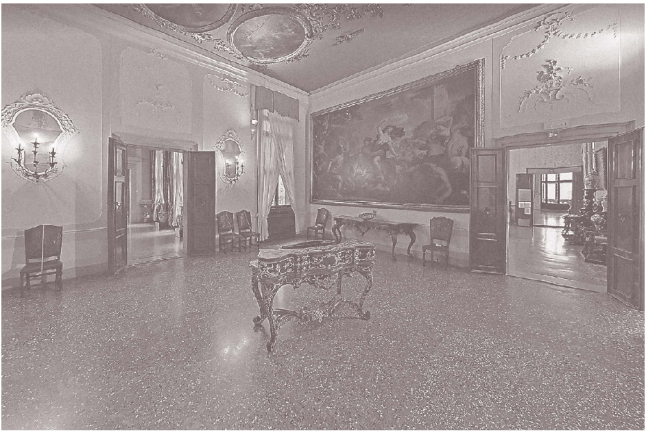
1. Пьетро Пиффетти. Письменный стол. 1741 год. Венеция. Зал Ладзарини дворца Ка-Реццонико

только ее. Зато, обладая этой функцией, вещь выходит за предписанные ей бытом границы и способна преобразовать пространство вокруг себя (илл. 1).