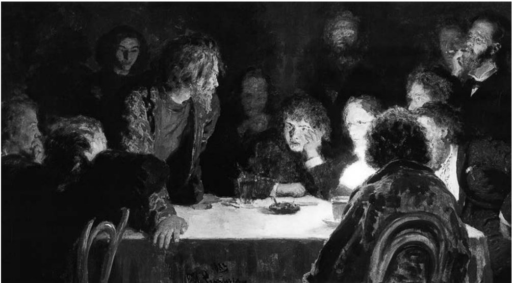
Илья Репин. Сходка (При свете лампы). 1883 год

не вполне понимал, насколько Ставрогин — фигура не типическая. «Это мировая трагедия истощения от безмерности, трагедия омертвения и гибели человеческой индивидуальности от дерзновения на безмерные, бесконечные стремления, не знавшие границы, выбора и оформления», — писал 13 о Ставrogине Бердяев. «...Человекобог, о котором мечтал Кириллов и по сравнению с которым сверхчеловек Ницше кажется только тенью, — писал литературовед Константин Мочульский, считавший Ставrogина величайшим художественным созданием Достоевского. — Это грядущий Антихрист, князь мира сего, грозное пророчество о надвигающейся на человечество космической катастрофе» 14 . Вячеслав Иванов описывал Ставrogина как «отрицательного русского Фауста», в котором угасла любовь: «Изменник перед Христом, он неверен и Сатане. <...> Он