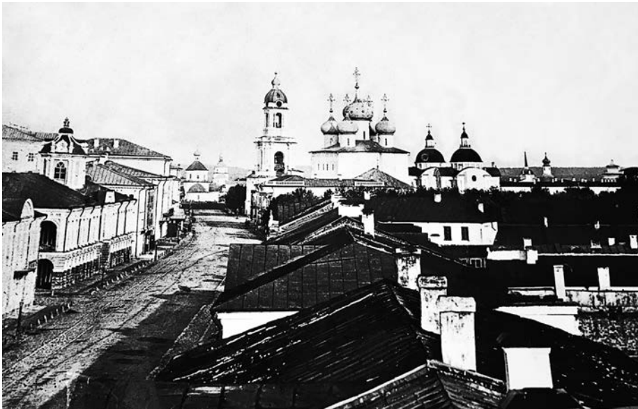
Миллионная улица в Твери. 1860 год. Тверь была прототипом губернского города в «Бесах»

внимательным. Единственная настоящая лакуна находится между восьмой и девятой главами: в этом месте, в самом центре романа, должна находиться глава «У Тихона», которую по цензурным соображениям отказался публиковать издатель «Русского вестника» Катков. В современных изданиях изъятая глава публикуется в виде приложения, в ней Николай Ставрогин исповедуется и фактически объясняет свое будущее самоубийство.