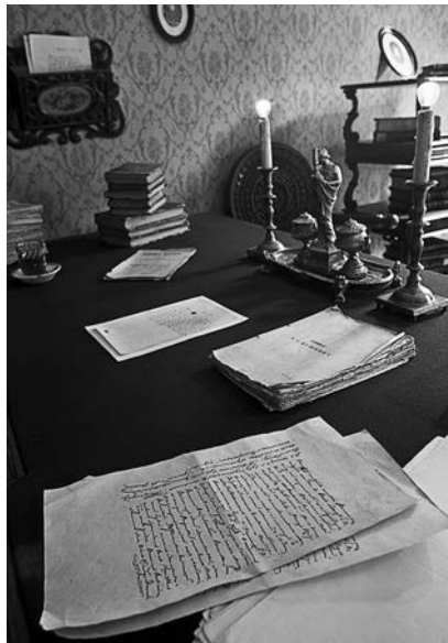
Рабочий стол в Доме-музее Федора Достоевского в Санкт-Петербурге

подвергают сомнению правдивость этой истории.