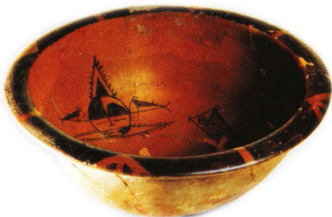
Керамический таз пэнь, украшенный узором в виде рыбы с человеческим лицом (культура Яншао, тип Баньпо)

Баньпо . Ее отличительная особенность в том, что внутреннее дно и вся наружная поверхность изделия украшались узорами в виде рыб, птиц, лягушек, оленей и геометрических фигур. Самым эффектным был узор в виде рыбы с человеческим лицом.