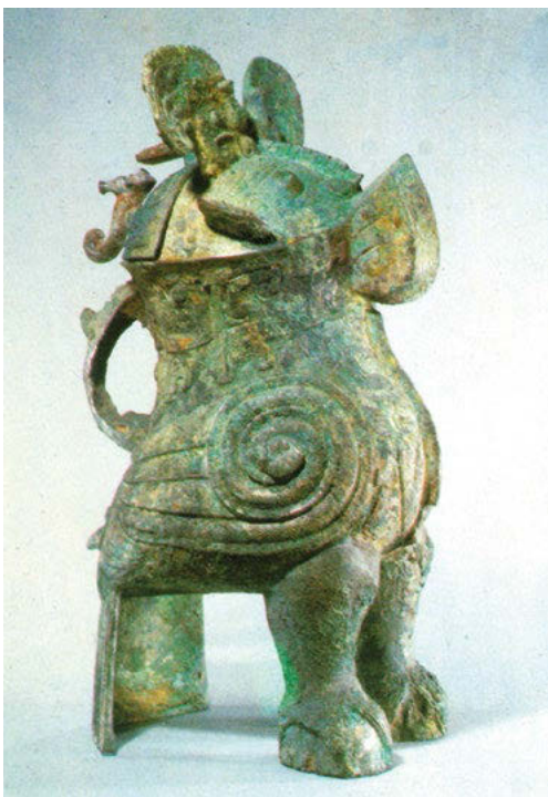
Орнамент на жертвенной чаше в виде совы (эпоха Шан)

третий — в монастыре Гаовансы в уезде Фэнсян провинции Шэньси. Кувшин из Байхуатаня украшен четырьмя рядами узоров. В первом верхнем ряду расположены упражняющиеся в стрельбе из лука аристократы, работающие на кухне слуги, собирающие тутовые листья мужчины и женщины. Во втором ряду — любующаяся танцами и метаящая стрелы на пиру знать. На третьем — сцены ожесточенных боев на суше и море. Четвертый ряд тоже посвящен сценам охоты аристократии. Художник изобразил только силуэты, но очень точно. Он уделил внимание вставкам и сочетанию элементов. Композиция достаточно изящна, что свидетельствует об определенном прогрессе живописи.