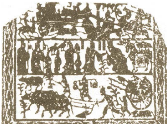
«Пахота на волах», каменный барельеф эпохи Восточная Хань (Сюйчжоу, Цзянсу)

времена члены императорской семьи, землевладельцы и даже рядовые чиновники среднего и низшего звена для снискания репутации сяоляня не жалели средств на роскошные захоронения своих родителей. На каменных стенах погребальных камер или залов жертвоприношений предкам стали высекать изображения с глубоким смыслом.