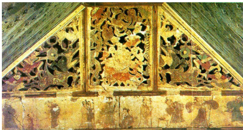
Фреска в гробнице эпохи Западная Хань (Лоян, Хэнань)

городского округа Сяньян в провинции Шэньси, в развалинах дворцов № 1 и № 3 были найдены фрагменты стенных росписей. На уцелевших фресках двух стен дворца № 3 изображены лошади с экипажами, сцены отправления в путь и встречи гостей, почетный караул, павильоны и дворцы, цветы, травы, деревья и другие рисунки, их окружают геометрические орнаменты. На фресках преобладают черный, красный и коричневый, немало белого, желтого, голубого, зеленого и других цветов. Изображенные объекты сочетаются между собой и отличаются декоративностью, это особенность ранней стеной росписи.