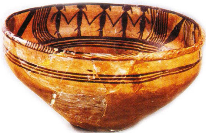
Керамический таз пэнь, украшенный узором в виде танцующих людей (культура Мацзяяо, тип Мацзяяо)

Мацзяяо. Для этого типа характерны орнаменты в виде водоворотов и волн — внешняя поверхность изделий полностью покрывалась вращающимися и волнообразными узорами, которые казались подвижными. Самым известным изделием, представляющим художественную ценность, является керамический