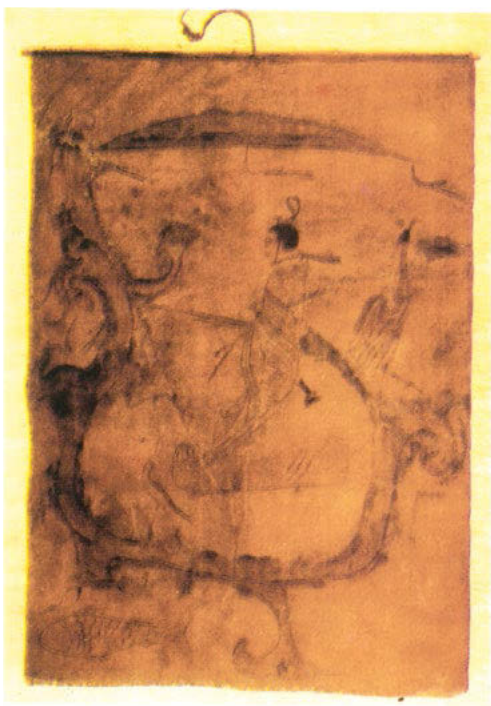
«Человек, управляющий драконом», картина на шелке (период Сражающихся царств, царство Чу)

аккуратны, они похожи на тонкие, длинные и закругленные паутинки, плавно парящие в пространстве картины. Часть изображения художники раскрашивали, что помогало выразить сюжет. Роспись по шелку периода Сражающихся царств играет важную роль в истории китайской живописи. Линейная техника, в которой выполнено большинство полотен, стала основным изобразительным приемом последующих эпох, раскрашивание также использовалось и развивалось. Можно сказать, что роспись по шелку периода Сражающихся царств стала отправной точкой для развития традиционной китайской живописи.