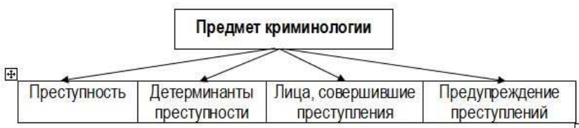
Рис. 1.1. Содержание предмета криминологии

Содержание предмета криминологии графически показано на рис. 1.1.