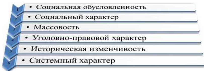
Рис. 2.1. Признаки преступности

В приведенном определении преступности выражена ее сущность с точки зрения социально-правовой обусловленности этого явления. Структурные компоненты определения обозначают наиболее существенные признаки понятия преступности и характеризуют ее содержание, реальное проявление (рис. 3.1).