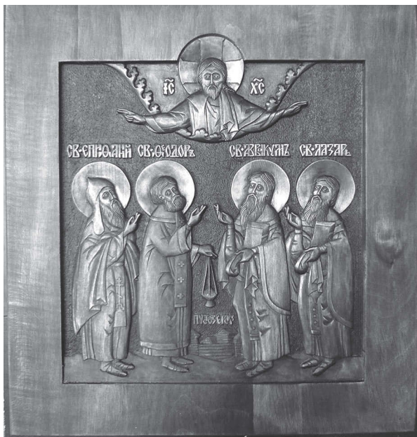
Пустозерские мученики. Резная икона работы П. Г. Варунина. 2012 г.

популярных версий две: одна из них гласит о том, что Аввакум был сожжен «за великия на царский дом хулы» (т. е. причина политическая), другая — что за «хулы на церковь» (т. е. причина религиозная).