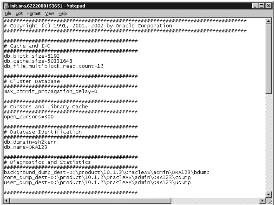
Рис. 1.1.1-1. Фрагмент инициализационного файла init.ora

ное пространство SYSTEM ) и для пользовательских данных (табличное пространство USER ).