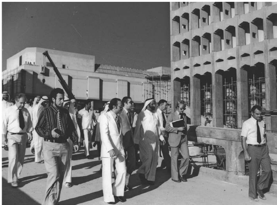
Рис. П. 4

Эксперты и советники сопровождают шейха Рашида бин Саида аль-Мактума (на фото в центре) во время визита на стройплощадку Всемирного торгового центра в Дубае. Около 1978 г.