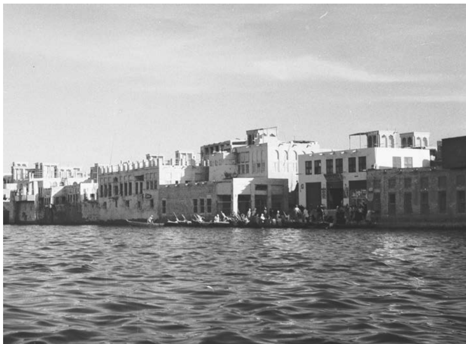
Рис. П. 1

Вид на Хор-Дубай с борта абры (небольшой лодки). Ноябрь 1959 г.