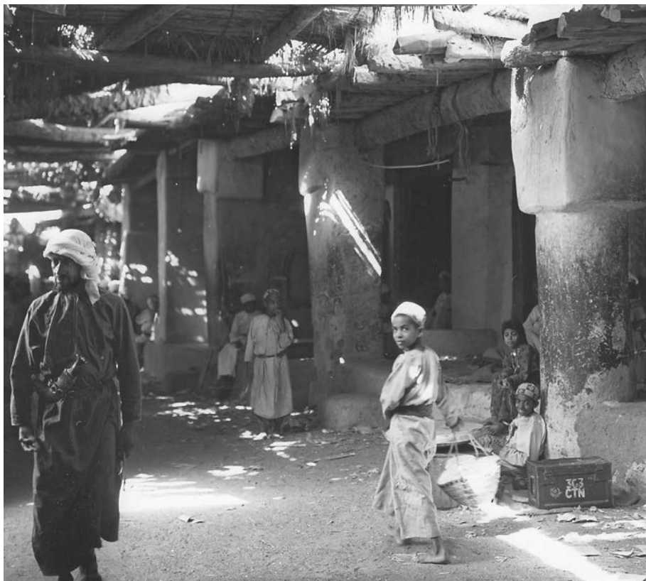
Рис. П. 2

Хозяева дубайского порта — арабские, южноазиатские и иранские торговцы — жили своей жизнью. Они пользовались некомпетентностью британских наблюдателей, поддерживая миф о порте, как реликте XIX в. На самом же деле торговцы Дубая мыслили вполне современно и тайно поддерживали обширные внешние связи. К неудовольствию англичан, город постепенно становился региональным центром торговли оружием и другими товарами. В город прибывала современная техника, а также новости и прочие веяния со всего мира. Коммерсанты слышали о политических переменах, происходивших поблизости, и о том, как за пределами Дубая приходит конец эпохе колониализма.