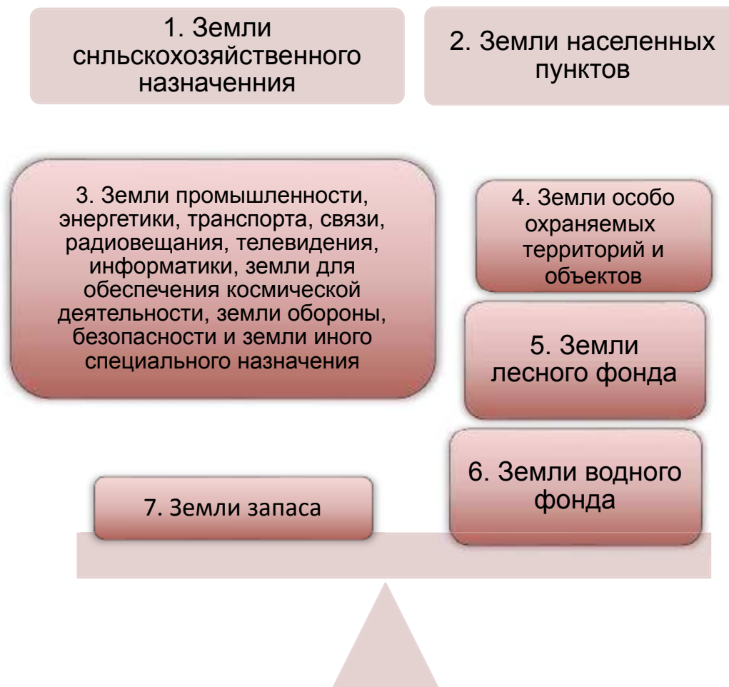
Схема 6. Состав земель в Российской Федерации