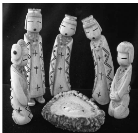
ДЕРЕВЯННЫЕ ИДОЛЫ ЗУНИ