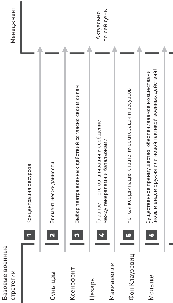
Рис. 1. Базовые военные стратегии, которые до сих пор актуальны в менеджменте