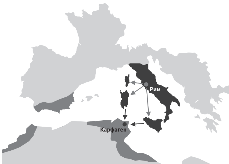
Рис. 2. Положение дел после Первой Пунической войны