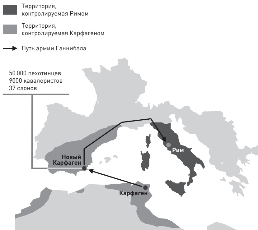
Рис. 4. Стратегическое решение Ганнибала: маршрут в Рим

Учитывая полководческий талант Ганнибала, который он продемонстрировал при разработке стратегии, возникает естественный вопрос: почему же все-таки через 17 лет он проиграл Вторую Пуническую войну? Один из ответов, предлагаемых историками, таков: ему не удалось беспрепятственно продвинуться ближе к Риму, закрепив позиции, завоеванные в результате первых побед. Вместо этого он ввязался в политическую и тактическую борьбу, которая в конечном счете ослабила армию карфагенян. Враг получил возможность собрать силы и подстроиться под стратегию Ганнибала.