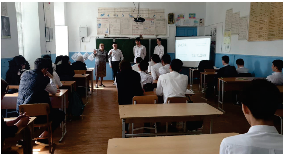
В МКОУ «Первомайская СОШ № 1 им. Героя Советского Союза С. К. Курбанова»

После тренинга был показан видеоролик «Террор — путь слабых». Присутствующим рассказали, как противостоять врагам нашей Родины на цифровой платформе и в реальной жизни. Старшеклассники показали интерес к этой теме, высказывали свое мнение об опасности безоглядно доверять людям, чьи конечные цели общения им непонятны, о многочисленных группах в WhatsApp и Телеграмм-каналах, которые делают упор на неконструктивную критику устоев нашего государства.