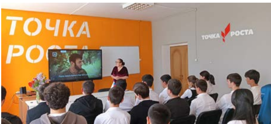
В МБОУ «Дружбинская СОШ»

После тренинга был показан видеоролик «Террор — путь слабых». Присутствующим рассказали, как противостоять врагам нашей Родины на цифровой платформе и в реальной жизни. Старшеклассники показали интерес к этой теме, высказывали свое мнение об опасности безоглядно доверять людям, чьи конечные цели общения им непонятны, о многочисленных группах в WhatsApp и Телеграмм-каналах, которые делают упор на неконструктивную критику устоев нашего государства.