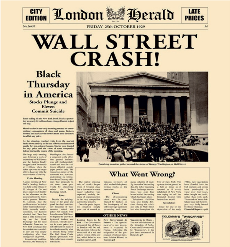
Рис. 3. Великая депрессия

остались причитающимися своим клиентам проценты по вкладам. Вслед за крахом в финансовом секторе начался кризис в производстве. Предприятия не могли получить новые кредиты и поэтому были закрыты. В первые годы кризиса закрылось 50 % фирм и фабрик США. Миллионы людей по всей стране остались без работы. К 1933 году безработица достигла 25 %. Те, кому удавалось сохранить работу, как правило, работали неполный рабочий день или месяцами не получали зарплату. Бесправные, голодные люди устраивали митинги и забастовки. Одной из крупнейших демонстраций 1920–30-х годов стал «Голодный марш» в Детройте, организованный бывшими рабочими завода Генри Форда.