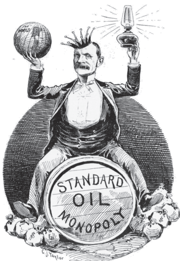
Рис. 1. Карикатура на Рокфеллера. США начало XX века