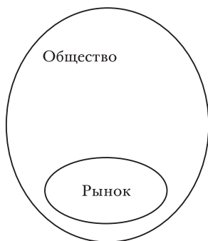
РИС. 2.2. «Вложенная» точка зрения: рынок встроен в общество

мается ими как неизбежно и глубоко встроенный в общество в целом, включая такие рыночные институты, как деньги и фирма. В данном случае рост сферы рыночных отношений может интерпретироваться как расширяющийся эллипс в рамках более широких социальных границ, отображенных на рис. 2.2. Растущий рынок взаимодействует с обществом, в процессе чего изменяются и первый и второе, даже тогда, когда рынок концептуально имеет генерализованные черты (Rosenbaum 2000). Установление воздействий растущего рынка на общество неоднозначно. Действительно, проведение границ между рынком и обществом носит бессистемный характер, что признают специалисты и по социальной, и по институциональной экономической теории (Waller 2004; Dolfsma and Dannreuther 2003b). Отсюда последствия расширения сферы рыночных отношений далеко не очевидны даже в тех случаях, когда повышение материального благосостояния не вызывает сомнений. Институциональные и социальные экономисты должны задать вопрос: «Какой ценой?» Поскольку расширение сферы