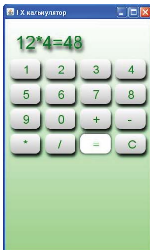
Рис. 3. Веб-калькулятор, написанный на JavaFX

Особенности технологии позволяют легко встраивать в приложения мульти-